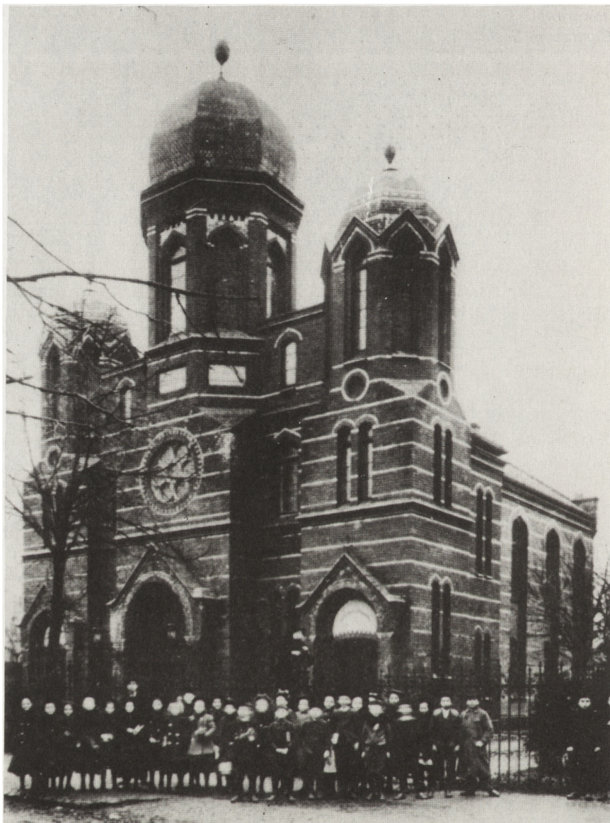
Malborska synagoga wybudowana w latach 1897—1898. Widok od zachodu. ok. 1910.