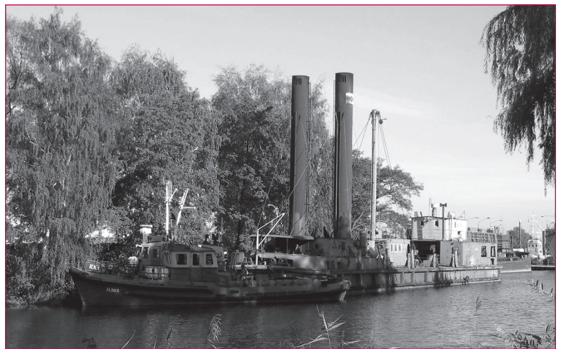
1. Pogłębiarka „Mamut” przy nabrzeżu w basenie „Cichym”, 2004 r.

Jednostka o stalowej nitowanej konstrukcji kadłuba posiadała dwa pokłady – główny i łodziowy. Na pokładzie głównym zachowały się oryginalne elementy: kompletne pompy - piaskowo-refulacyjna i pługująca,