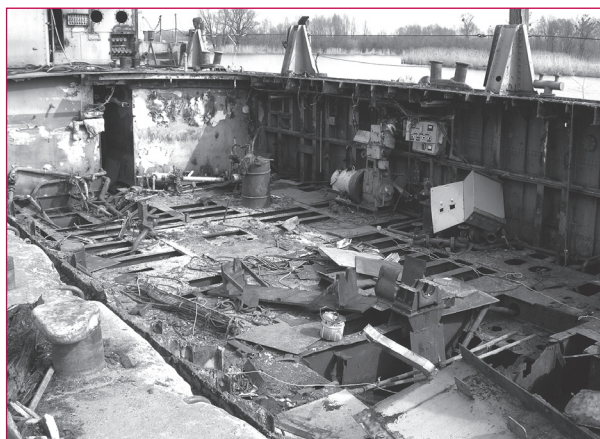
5. Pogłębiarka „Mamut”, stan po zniszczeniu, wewnątrz, 04.2006 r.

W tej sytuacji WKZ ponownie zawiadomił prokuraturę o podejrzeniu popełnienia przestępstwa, tym razem polegającego na zniszczeniu obiektu, wobec którego toczy się postępowanie o wpisanie do rejestru zabytków. Wobec całkowitej dewaloryzacji tego obiektu WKZ zmuszony był w czerwcu 2006 r. wydać decyzję o umorzeniu postępowania w sprawie wpisania do rejestru zabytków. Tymczasem postanowieniem z dnia 13 września 2006 r. Prokuratura Rejonowa Szczecin-Śródmieście umorzyła śledztwo w obu sprawach. W sprawie o sfalszowanie dokumentu stwierdzono „brak danych dostatecznie stwierdzających podejrzenie popełnienia czynu zabronionego” i to mimo istnienia dowodu w postaci wspomnianego fałszyfikatu, którym posługiwał się podejrzany. W sprawie o zniszczenie zabytku nie dopatrzono się „znamion czynu zabronionego”. W odpowiedzi Wojewódzki Konserwator Zabytków złożył zażalenie na postanowienie prokuratury. Po ośmiu miesiącach wydała ona kolejne postanowienie – tym razem o zawie-