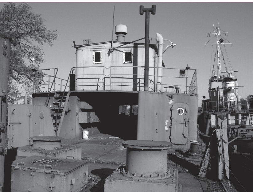
2. Pogłębiarka „Mamut”, część rufowa pokładu, 2005 r.

i maszynownia. W kotłowni znajdowały się m.in. dwa kotły cylindryczne, dwupłomienicowe typu szkockiego, wybudowane w 1954 r. przez firmę niemiecką Wilke Werke A.G. Braunschweig. Początkowo opalane węglem, na początku lat 60. przystosowane zostały do opalania mazutem. Maszynownia wyposażona była w oryginalną maszynę parową główną o mocy 600 KM. Służyła ona do napędu pompy piaskowej odśrodkowej o wydajności 400 m 3 /h, przeznaczonej do przetaczania urobku, sprzężonej ze skrzynią do osadzania kamieni. Pompa odśrodkowa do mułu (płuczka), o wydajności 250 m 3 /h, służyła do nawadniania urobku. Z czasów budowy pogłębiarki pochodziła ponadto maszyna parowa z pompą odśrodkową cyrkulacyjną, o wydajności 380 m 3 /h.