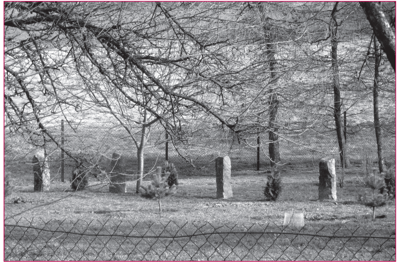
5. Czerniki w gminie Kętrzyn. Ciosane kamienie przydrożne, chyba najczęściej jeszcze spotykane dziś przy warmińskomazurskich drogach, znalazły zastosowanie w jednym z przydomowych ogródków.

włączył się także odpowiedni urząd konserwatorski oraz Ministerstwo Gospodarki i Pracy. Stworzono z tego wręcz produkt turystyczny. Dla „równowagi” musimy także poinformować o inicjatywach krajowych w tym samym temacie. W Skwierzynie w woj. lubuskim Generalna Dyrekcja Dróg Krajowych i Autostrad utworzyła Izbę Pamięci Drogownictwa, w której urządzono skansen z obiektami stosowany-