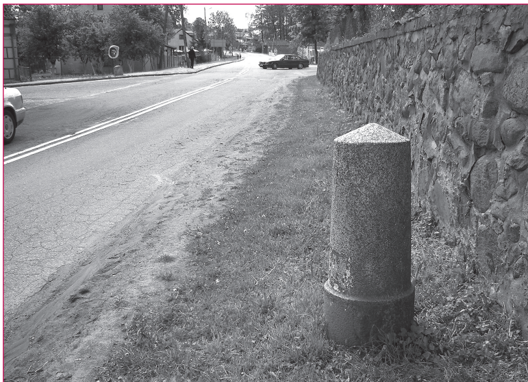
4. Rysunek z wymiarami jednego z kamieni znajdujących się pierwotnie przy drodze Reszel – Święta Lipka (rys. P. Szarzyńska). 5. Kamień milowy w Lutrach, w gminie Kolno. W głębi po lewej, obok budki telefonicznej, widoczny inny rodzaj kamienia przydrożnego.

obowiązki i biorąc pod uwagę wartość zabytku (do rejestru nie wpisuje się tzw. pierwszego lepszego) powinien się on z nich wywiązywać, zwłaszcza jeśli właścicielem jest jednostka państwowa lub samorząd. Kradzieże nie mogą legitymizować braku zainteresowania i opieki nad tego typu zabytkami. Wydaje się, iż odpowiednie oznakowanie obiektu z informacją o wartości i rodzaju zabytku może stać się dodatkową formą – atutem jego ochrony (co ma miejsce w przypadku innych zabytków) i może spowodować także, iż okoliczni mieszkańcy – lokalna społeczność – będą