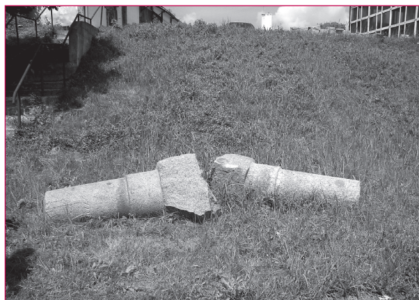
1. Kamienie milowe znajdujące się pierwotnie przy drogach w okolicach wsi Sędławki i Łabędnik, w gminie Bartoszyce. Wykopane podczas prac drogowych, obecnie są porzucone na terenie przedsiębiorstwa Rejonu Dróg Wojewódzkich w Kętrzynie.

bu Rorhera z 1835 roku, w którym określono także ich parametry. Kamienie te ustawiano w miejscach, gdzie dotąd nie było żadnych oznaczeń odlegściowych. W ogromnej większości pełniły one rolę kamieni całomilowych, co znajduje potwierdzenie w zachowanych do dziś egzemplarzach na terenie województwa warmińsko-mazurskiego. W prowincji wschodniopruskiej wykluczono już wówczas, stosowane na innych terenach państwa pruskiego, oznaczenia milowe wykonane z żeliwa. W momencie wprowadzenia w Niemczech systemu metrycznego w latach 1872-1873 oznaczenia kamieni milowych przestały automatycznie spełniać swoją rolę i tym samym kamienie te utraciły na znaczeniu. Nieliczne z kamieni zostały oznaczone w nowy sposób lub przestawione. Na skutek remontów dróg do dziś zachowało się niewiele tego typu obiektów. Obecnie następcami kamieni milowych są ustawiane wzdłuż dróg słupkowe oznaczenia kilometrowe.