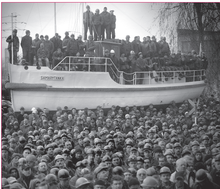
5. Gdynia, stalowa motorówka ratownicza "Samarytanka", pierwsza jednostka zaprojektowana i zbudowana w "Stoczni Gdyniskiej" dla Urzędu Morskiego, zwodowana 17 września 1931 r., odnowiona w 2005 r., eksponowana przed budynkiem dyrekcji Stoczni Gdynia SA (kontekst tożsamości społecznej); wiec stoczniovców 1 grudnia 2008 r. (kontekst polityczny). Zdjęcie roku Grand Press Photo.

pierwotnej funkcji obiektu, pracy maszyn i ich obsługi, pokazanie powstawania produktu itp. Pożądanym interpretatorem jest autentyczny pracownik, który może podzielić się własnymi doświadczeniami i pokazywać umiejętności nabyte podczas rzeczywistej pracy; jest to aspekt „konserwacji” dziedzictwa niematerialnego.