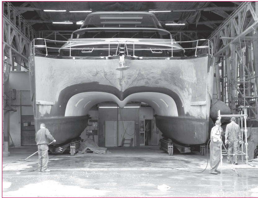
3. Gdańsk, były tereny Stoczni Gdańskiej z najstarszymi zabudowaniami; produkcja jednostek pływających trwa... (kontekst zachowania funkcji po likwidacji produkcji wielkoprzemysłowej).

Jeżeli między tymi aspektami wystąpi zgodność, to można rozważać odpowiednie działania inwestycyjne. Do rozpoznania i oceny stopnia pilności danej potrzeby należy wykorzystywać: różne metody badania opinii publicznej oraz stosować krytyczne porównanie ich wyników; ekspertyzy i diagnozy społeczne; przewidywania demograficzne, strategiczne plany rozwoju społeczno-gospodarczego i plany rozwoju kultury. Mogłoby się wydawać, że podstawowe cele adaptacyjne wyczerpuje komercyjny pakiet deweloperski: centrum handlowe, kompleks rozrywkowy, mieszkalnictwo (tzw. lofty) oraz przestrzeń biurowa na wynajem, gdy tymczasem repertuar rzeczywistych potrzeb społecznych jest inny i obejmuje szeroki wachlarz sfery socjalnej jak np. hospicja, ośrodki leczenia uzależnień, domy opieki, noclegownie dla bezdomnych; mieszkania interwencyjne; lokale siedzib organizacji pozarządowych, kluby zainteresowań, ośrodki