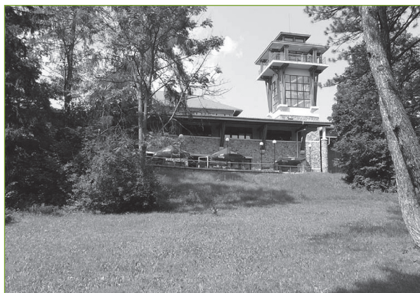
1. Park w Białowieży. W miejscu pałacu wzniesiono Muzeum Przyrodnicze i hotel, trwale przekształcając historyczny układ przestrzenny.

Elementy architektury ogrodowej, wpisane do rejestru zabytków, związane z założeniami rezydencjonalnymi – pawilony, fontanny, pomniki, bramy, ogrodzenia – to 2930 obiekty.