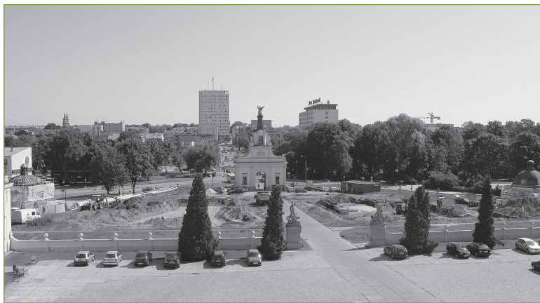
3. Założenie pałacowo-ogrodowe Branickich w Białymstoku. Widok od strony pałacu na dziedzińiec wstępny, lipiec 2009 r.

W tym miejscu należałoby zaznaczyć, że w ponad 13-letniej historii rewaloryzacji Ogrodu Branickich odnotowano stosunkowo niewiele negatywnych gło-