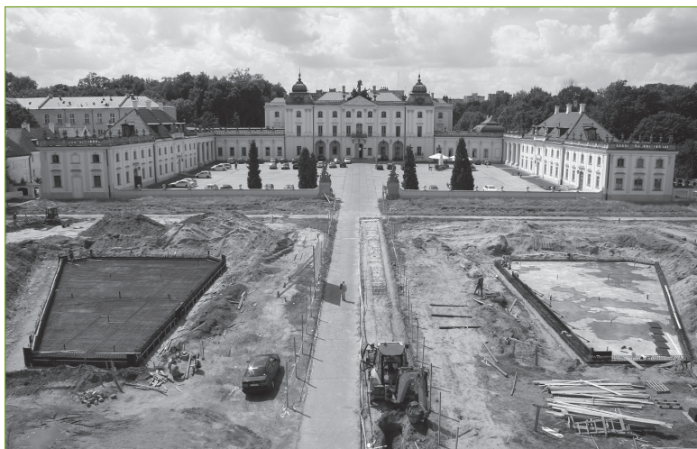
4. Założenie pałacowo-ogrodowe Branickich w Białymstoku. Widok z Bramy Wielkiej pod Gryfem na dziedziniec wstępny, lipiec 2009 r.

dokładał starań, by temat ogrodu, jego historyczne znaczenie i potrzeba rewaloryzacji, nie zniknął na długo z lokalnych mediów. Mimo iż zdawano sobie sprawę, że zamieszczanie informacji w codziennej prasie to działania niewystarczające, to na szerszą promocję nie przeznaczano środków.