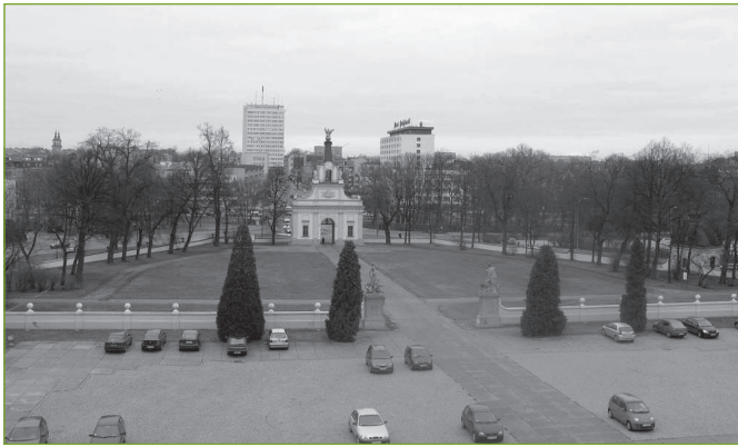
2. Założenie pałacowo-ogrodowe Branickich w Białymstoku. Widok od strony pałacu na dziedziniec wstępny, luty 2008 r.

Równoległe, z niewielkimi przerwami, prowadzono prace pielęgnacyjne zabytkowej zieleni, wydając rocznie od 100 do 200 tys. złotych. W 1998 r. samorząd miejski pozyskał dotację z budżetu Wojewódzkiego Konserwatora Zabytków w Białymstoku w wysokości 15 tys. zł, na rekonstrukcję pierwszego bukszpanowego parteru. Podejmowane w latach następnych próby poszukiwania środków zewnętrznych na rewaloryzację ogrodu, m.in. w fundacjach polsko-amerykańskich, Narodowym Funduszu Ochrony Środowiska i Gospodarki Wodnej czy Ministerstwie Kultury kończyły się niepowodzeniem. W roku 2002 wystąpiła nawet realna groźba zaniechania dotychczasowych działań, a w konsekwencji nawet odstąpienia od realizacji projektu.