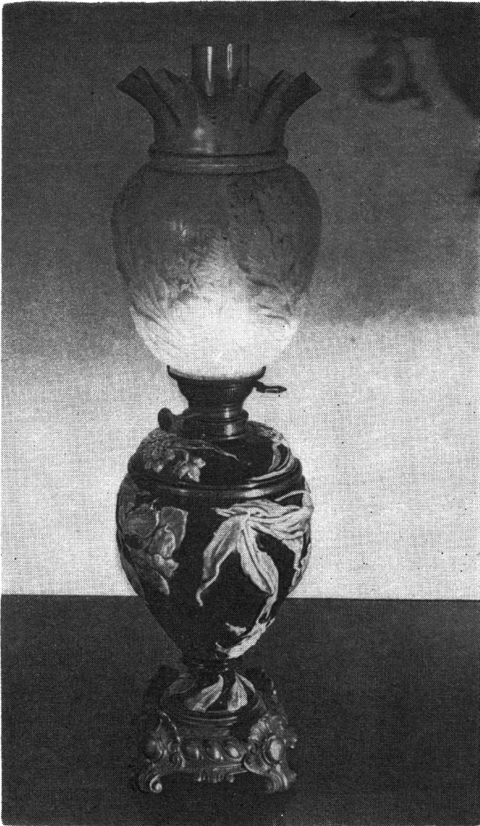
Ryc. 1. Jedna ze stojących lamp naftowych (nr katalogu 40)

townej lampy mosiężnej z kloszem mosiężnym, charakterystycznym dla stylu empire , nakrywającym właściwy klosz szklany, zwracały uwagę lampy o pięknie dekorowanych podstawach porcelanowych i majolikowych (ryc. 1). Pokazano też często używane lampy z kolumnami w podstawie oraz jeszcze bardziej rozpowszechnione lampy o podstawach szklanych i cynkowych.