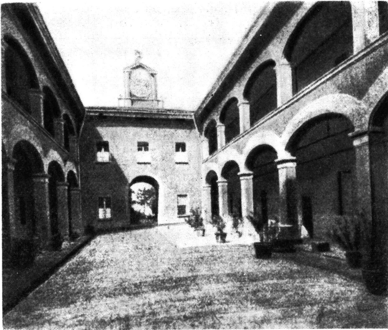
Ryc. 2. Dziedziniec Kolegium