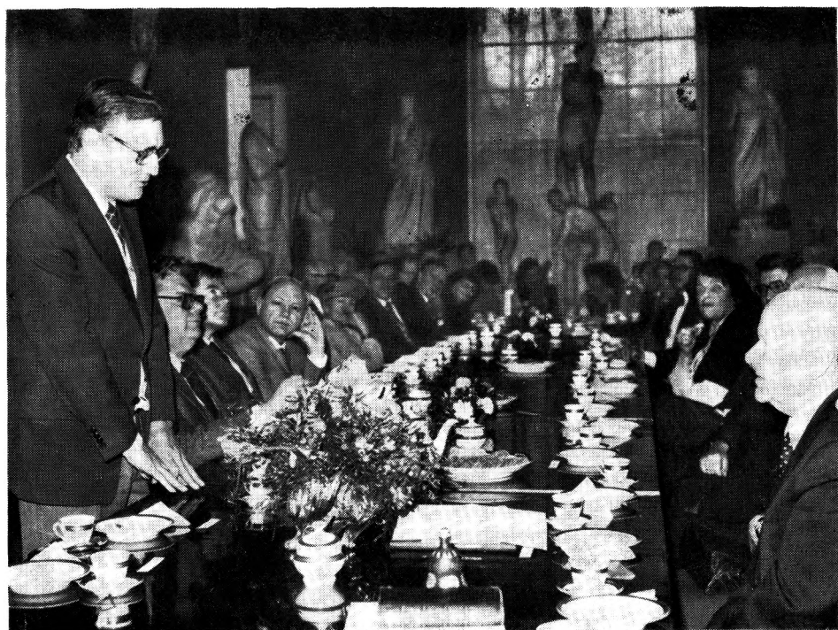
Ryc. 6. Przemawia prof. Aleksander Gieysztor — na przeciwko prof. S. Lorentz