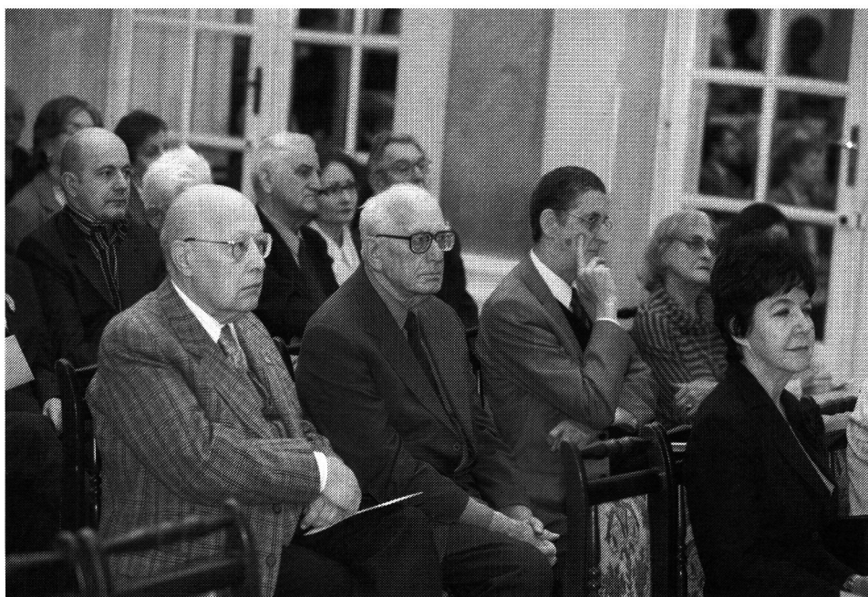
W czasie sesji.