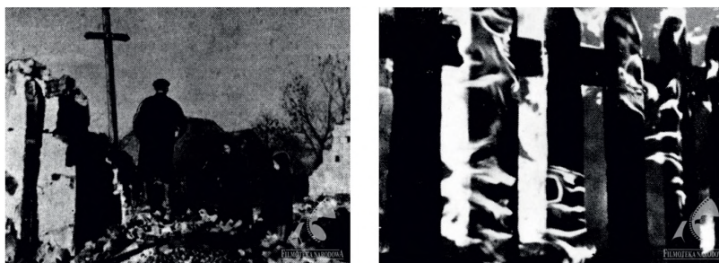
Ilustracje 6, 7. Kadry z filmu Gore! (1936), reż. E. Cękański

Film został pozytywnie przyjęty przez krytykę; doceniono nie tylko jego wartość społeczną, ale dostrzeżono w nim także walory artystyczne, które coraz częściej w tego typu krótkich produkcjach wychodziły na plan pierwszy. Sam współautor, Wohl, podkreślał też duże znaczenie dramaturgiczne, jakie pełniła w nim skomponowana przez Lutosławskiego muzyka 26 . Podobnie jak w przypadku wcześniejszych realizacji, niemożliwym jest omówienie jej przebiegu, bowiem film nie przetrwał próby czasu.