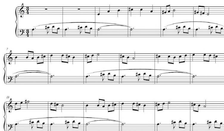
Przykład 1. W. Lutosławski, Odrą do Bałtyku , cz. I / 4, t. 12–29, melodia Zasiali górąle

Druga część filmu, wypełniająca prawie jego połowę, odnosi się do Śląska. Poszczególne sceny prezentują pracę w kopalniach oraz hutach. Działalność tych ośrodków była potwierdzeniem przemysłowego rozwoju wolnej Polski. Muzyczne opracowanie omawianej części charakteryzuje zastosowana motoryka przebiegu, która ilustruje pracę ludzi i maszyn, a także użycie atonalnych oraz politonalnych melodii, często wykorzystujących drobnointerwałowe pochody. Jednym z najbardziej wyrazistych odcinków muzycznych w tej części jest melodia utrzymana w toccatowym charakterze, towarzysząca kadrom ilustrującym transport kolejowy (zob. przykład 2). We fragmencie filmu, w którym ukazywane są odlewy hutnicze, bardzo wyraźnie słychać realizowane w partii fortepianu pochody dźwięków wskazujące na próby wprowadzania odrębnej skali 38 . Można zaobserwować też pewnego rodzaju dźwiękonaśladownictwo.