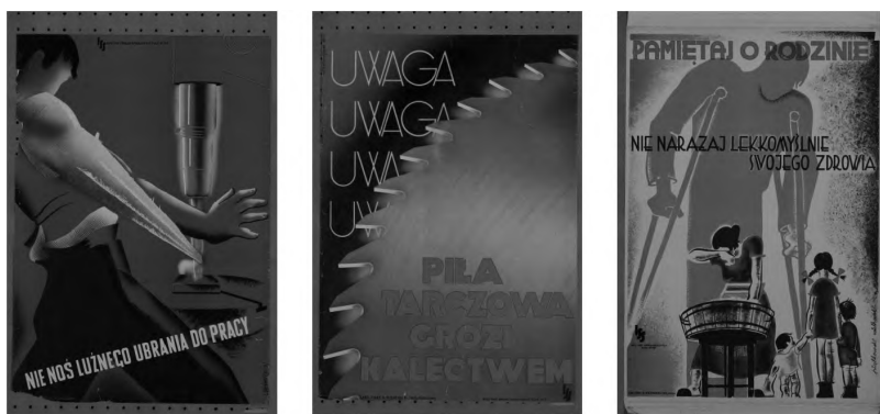
Ilustracje 1–3. Plakaty propagandowe Instytutu Spraw Społecznych 8

Wskutek wzajemnego porozumienia się wszystkie niemal instytucje ubezpieczeń społecznych postanowiły powołać fundację, poświęconą naukowemu badaniu i propagowaniu zagadnień, z dziedziny ochrony, bezpieczeństwa i higieny pracy, ubezpieczeń społecznych, rynku pracy, bezrobocia, emigracji i opieki społecznej 7 .