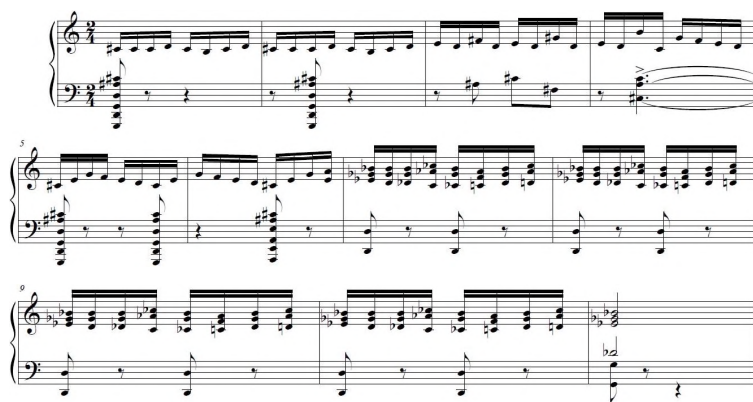
Przykład 2. W. Lutosławski, Odra do Bałtyku , cz. II /8, t. 6–16

Trzecią część filmu stanowi krótki przegląd miast polskich znajdujących się na szlaku Odry, a wśród nich: Kędzierzyn, Opole, Brzeg, Wrocław, Lignica [ob. Legnica – przyp. W.M.] i Głogów. Ich zdjęcia miały m.in. pokazać skalę dokonanych zniszczeń (stąd zgłiszcza zamków, kamienic czy zdewastowanych cmentarzy), ale również zaprezentować typowo polskie (piastowskie) zabytki, które przetrwały wojenne egzekucje. Muzyka w tej części filmu ma zgoła odmienny charakter. Melodie w przeważającej mierze korzystają z materiału tonalnego, choć chwilami zdają się od niego odchodzić. Tym, co zmieniło się w stosunku do części poprzedniej, jest zdecydowane uspokojenie tempa i rytymiki przebiegu muzycznego. Przełamuje je jedynie scena, w której narrator opowiada historię walk wojsk Bolesława Krzywoustego na Psim Polu. Lutosławski skomponował do niej imitującą tętent koni melodię, realizowaną przez klarnet i trąbkę, oraz fanfarowe sygnały trąbki przypominające odgłosy instrumentów używanych przez walczące oddziały 39 . Kadry z odzyskanych miast przeplatają się z widokami wsi, pól, łąk i terenów nadrzecznych. W warstwie dźwiękowej ponownie towarzyszą temu cytaty z Zasiali górale , a w końcowej części melodia pieśni Przybyli ułani pod okienko oraz, nieco dalej, podczas przywołania obrazu orki, nałożona na nią