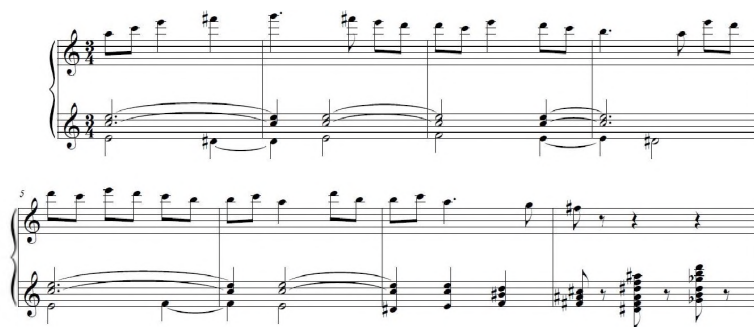
Przykład 3. W. Lutosławski, Suita warszawska , cz. II, t. 12–19, melodia skrzypka

smyczkowej). Muzyka nabiera nieco tempa i ożywienia w scenach budowy osiedli mieszkaniowych z terenami zielonymi. Wyraźnie zmienia się charakter melodii na bardziej marszowy, a kulminacją są fanfary orkiestrowe podczas scen ukazujących nowo wzniesione bloki mieszkalne. Z każdą kolejną minutą filmu Warszawa staje się miastem coraz bardziej zaludnionym, zmotoryzowanym. Tempo zmian filmowych obrazów zwiększa się, pojawiają się zatłoczone ulice, a wraz z nimi ożywia się dalej muzyka, która niejako podkreśla poprzez swoją motorykę ukazywany na filmie ruch pieszy i samochodowy.