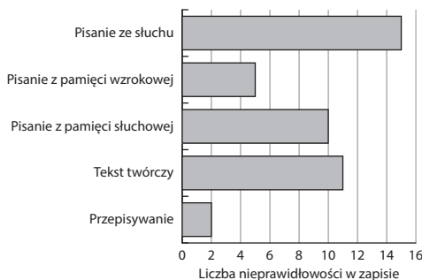
WYKRES 1. Liczba nieprawidłowości zapisu

Nasilenie błędów w poszczególnych próbach obrazuje wykres 1.