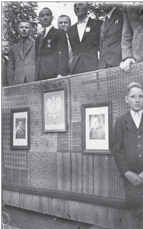
Strzelce, lato 1945

Po kapitulacji, a zwłaszcza po wysiedleniu Niemców, wzmożł się napływ osadników, co nieznacznie ratowało sytuację, jednakże okres, aż do przybycia pierwszych repatriantów (około połowy czerwca) należał do najtrudniejszych i najbardziej dramatycznych w pracy urzędu pełnomocnika. W chwili wysiedlenia Niemców liczbę ludności polskiej łącznie z milicją określało się na około 220 osób w powiecie. Karmienie zwierząt gospodarskich i ptactwa domowego w tych warunkach było nie lada problemem. Toteż poza dyżurem przy telefonie wszyscy pracownicy Starostwa przebywali w terenie. Nie było