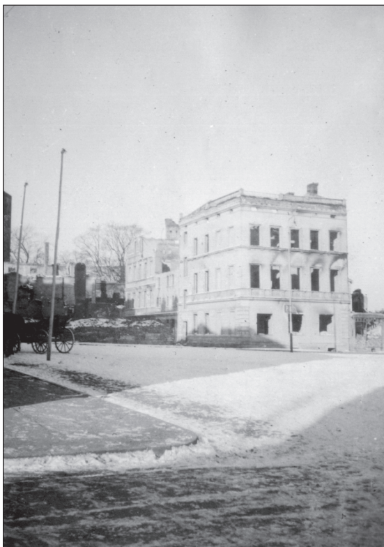
Strzelce, lata 40.

Drugie i właściwie ostatnie (pozostała tylko do jesieni niewielka liczba fachowców) wysiedlenie Niemców miało miejsce w lipcu 1945 9 . W tym też miesiącu nastąpiły zmia-