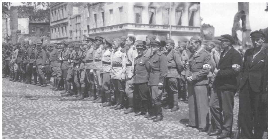
Strzelce, lato 1945