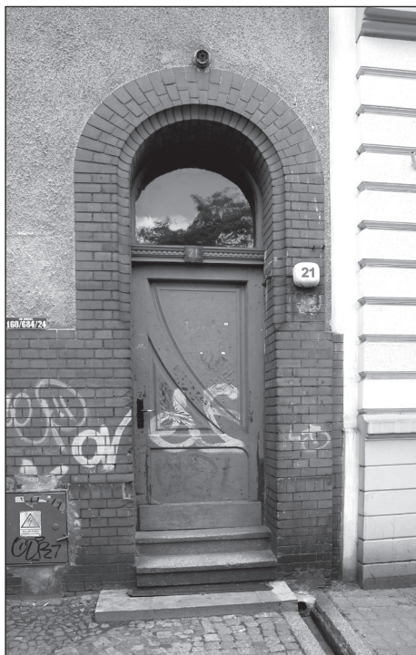
Boczne drzwi z płycinami zdobionymi płaskorzeźbą i nadświetlem