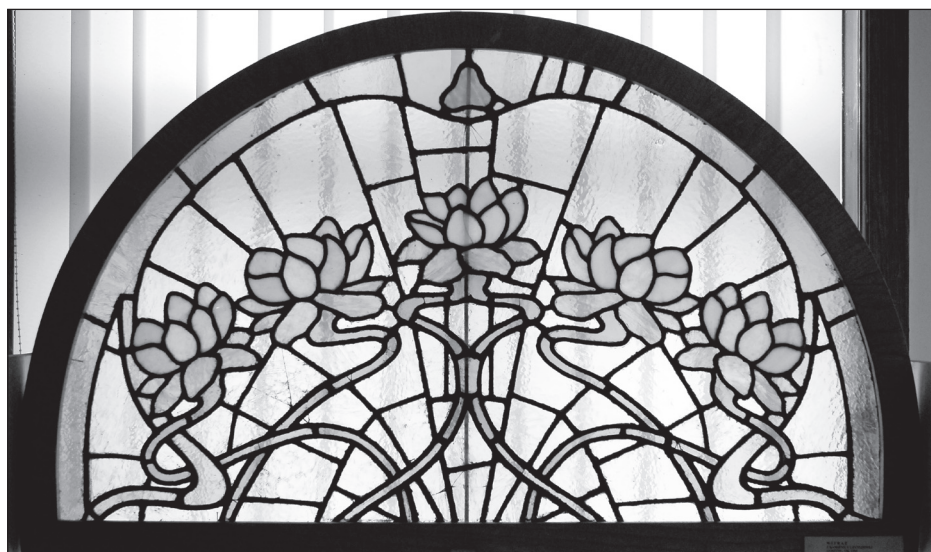
Lilie wodne – górny fragment witraża z półpiętra klatki schodowej domu, 1903; Muzeum Lubuskie im. Jana Dekerta w Gorzowie Wlkp.