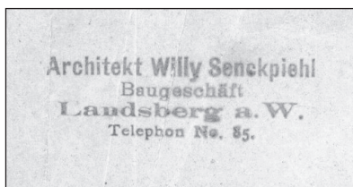
Odcisk pieczęci architekta Willy'ego Senckpiehla