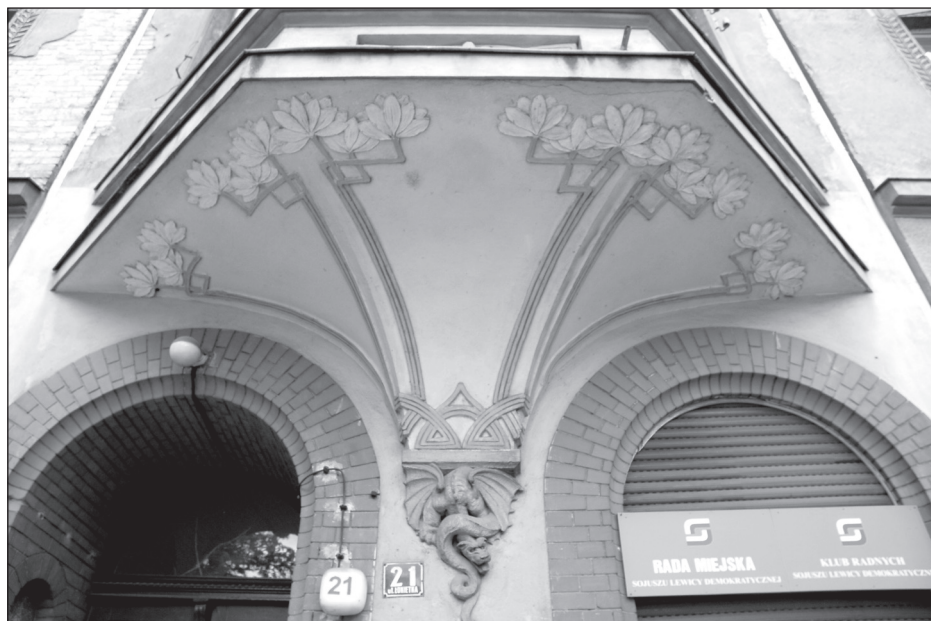
Fragment dolnej dekoracji wykusza ze wspornikiem w kształcie szkydlatego smoka od strony ul. Łokietka