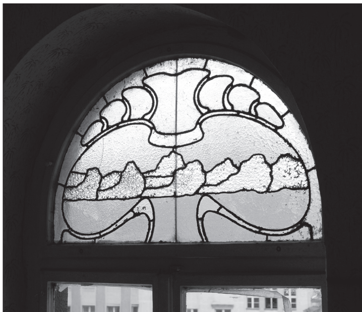
Witraż z motywem chmur w klatce schodowej budynku, 1903