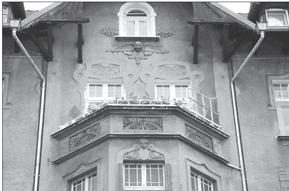
Fragment reliefowej dekoracji górnej partii fasady domu przy ul. Łokietka 21