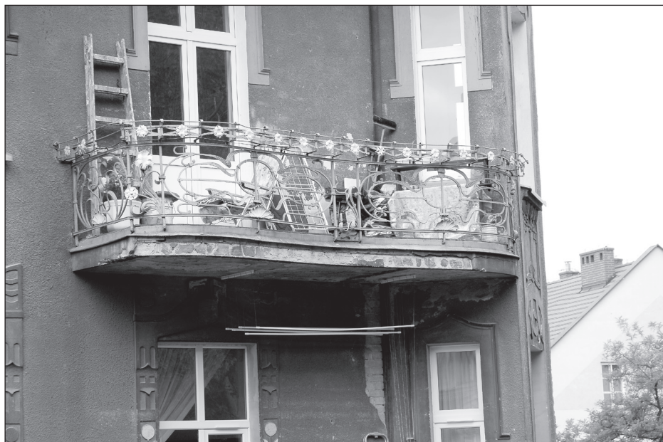
Balustrada balkonowa domu od ul. Drzymały (3 piętro) wykonana w nieznanej pracowni ślusarskiej