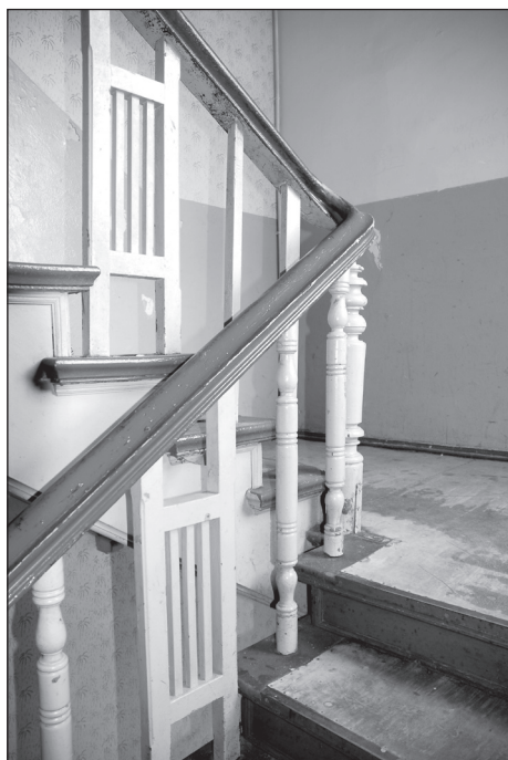
Balustrada głównej klatki schodowej