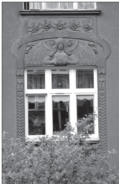
Fragment reliefowej dekoracji górnej partii elewacji domu od strony ul. Drzymały