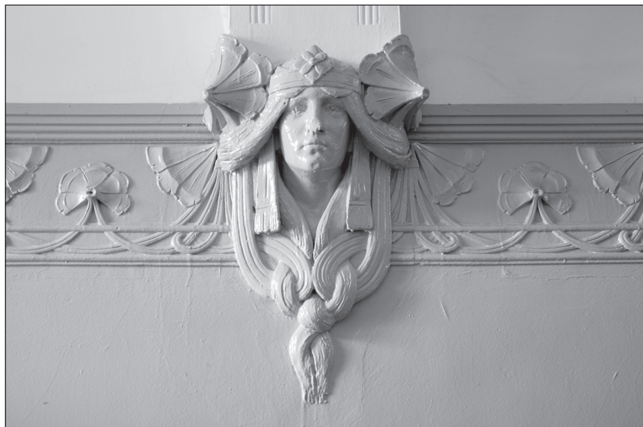
Dekoracja stiukowa w sieni klatki schodowej domu, fragment