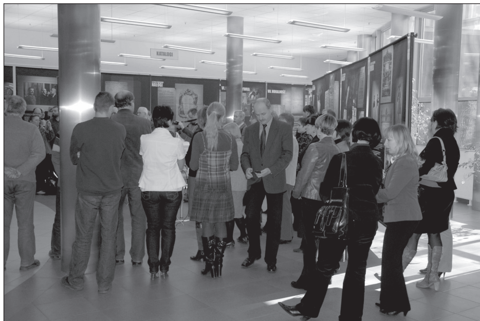
Otwarcie wystawy „Co kryją archiwa?”

10 W holu Wojewódzkiej i Miejskiej Biblioteki otwarto wystawę pt. „Dwa oblicza archiwów – co kryją archiwa?” zorganizowaną przez Naczelną Dyрекcję Archiwów Państwowych. Wystawa prezentowała nietypowe archiwalia znajdujące się w zasobie polskich archiwów państwowych.