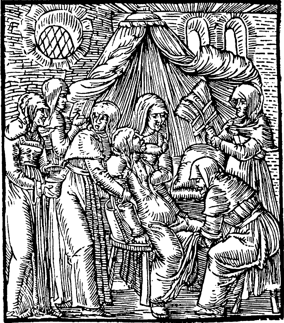
Poród – drzeworyt (S. Falimirz, O ziołach i mocy ich , op. cit.); za: Polonia Typographica saeculi sedecimi... , op. cit., tabl. 257.