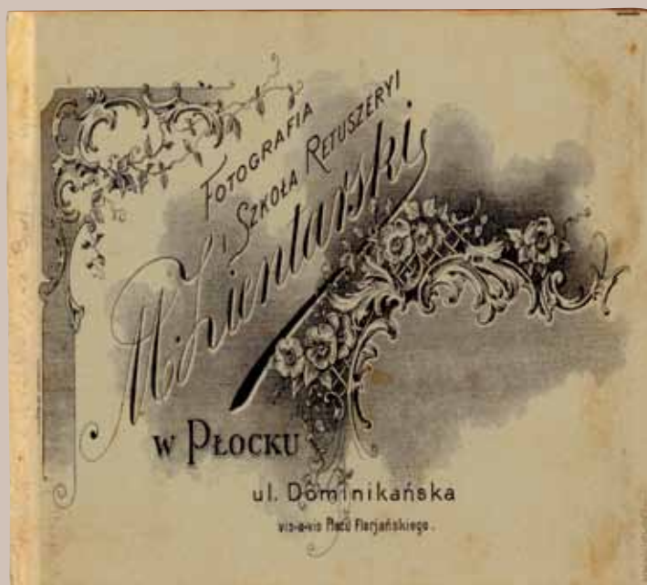
3. Odwrocie (rewers) kartonika fotografii z zakładu fotograficznego Mieczysława Zientarskiego przy ul. Dominikańskiej 1.