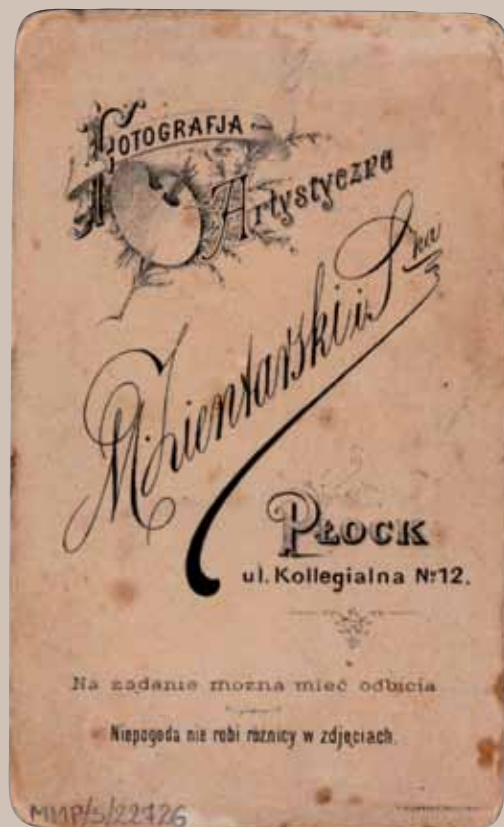
2. Odwrocie (rewers) kartonika fotografii z zakładu fotograficznego Mieczysława Zientarskiego i S-ki przy ul. Kollegialnej 12.