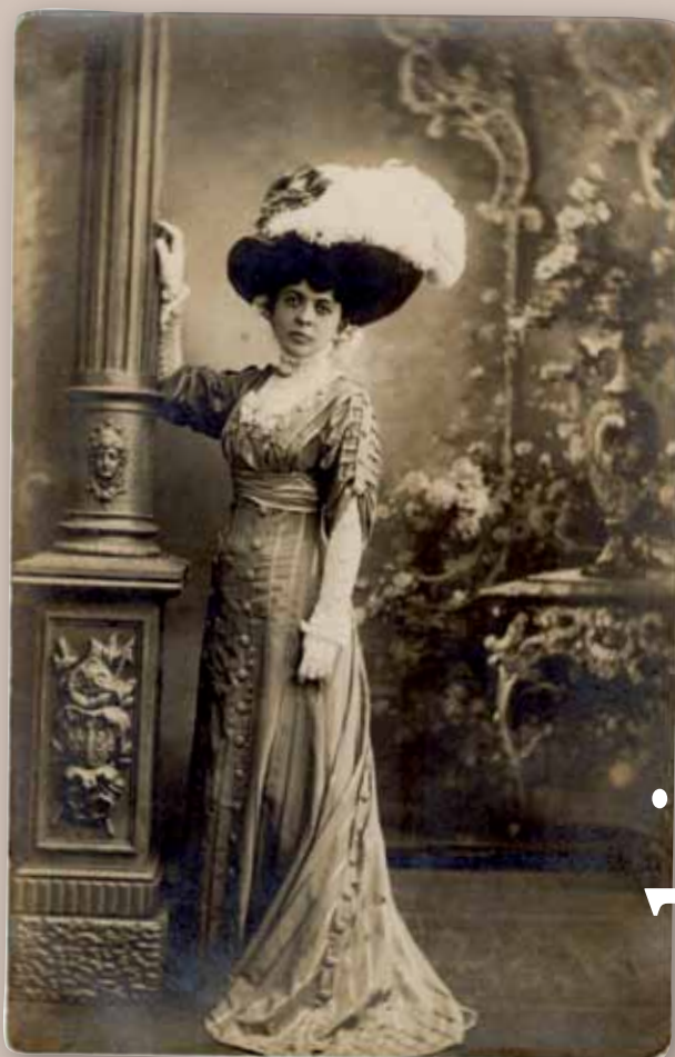
8. Portret płocczanki w stroju secesyjnym.