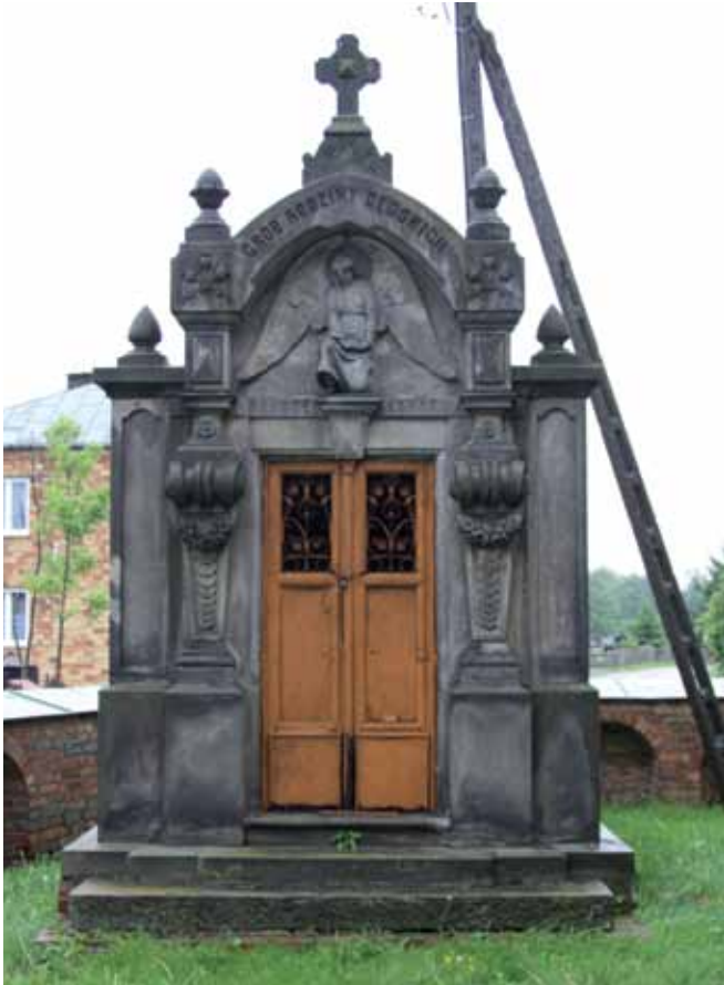
Kaplica grobowa Dębskich – wygląd współczesny