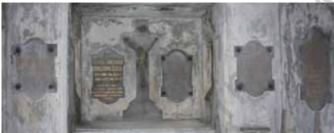
Wnętrze kaplicy; fot. K. Matusiak.

zające się ku dołowi pilastry z ornamentami cekinowymi, zwieńczone ślimacznicami, pod którymi zwieszają się dekoracyjne festony. Ponad drzwiami, w tympanonie, usytuowana jest płaskorzeźba (wypełniająca całą jego przestrzeń) przedstawiająca czuwającego nad zmarłym anioła o rozpostartych skrzydłach: klęczącego na lewym kolanie (według projektu na kolanie prawym), ze spuszczoną głową i dłońmi złożonymi do modlitwy, odzianego w długą tunikę. Ponad jego sylwetką znajduje się inskrypcja majuskułą: „Grób rodziny Dębskich”. Po obu stronach napisu widnieją motywy makówek symbolizujących sen wieczny: projekt przewidywał motyw pojedynczych kwiatów, natomiast współcześnie widoczne są tu wiązanki kwiatów maku i kłosów zboża. Fronton wieńczy krzyż na ozdobnej podstawie w formie dwóch esownic w symetrycznej kompozycji jednoosiowej. Po bokach element wieńczący stanowią sterczyny o jajowatym kształcie z ornamentem roślinnym.