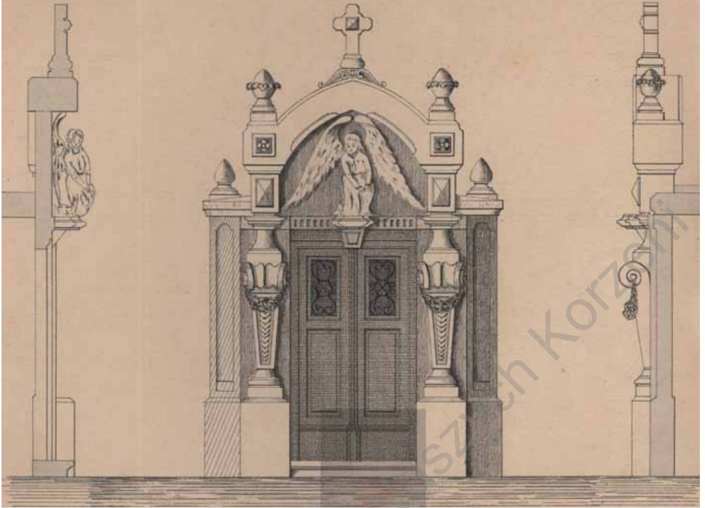
Fasada i fragmenty elewacji bocznych.