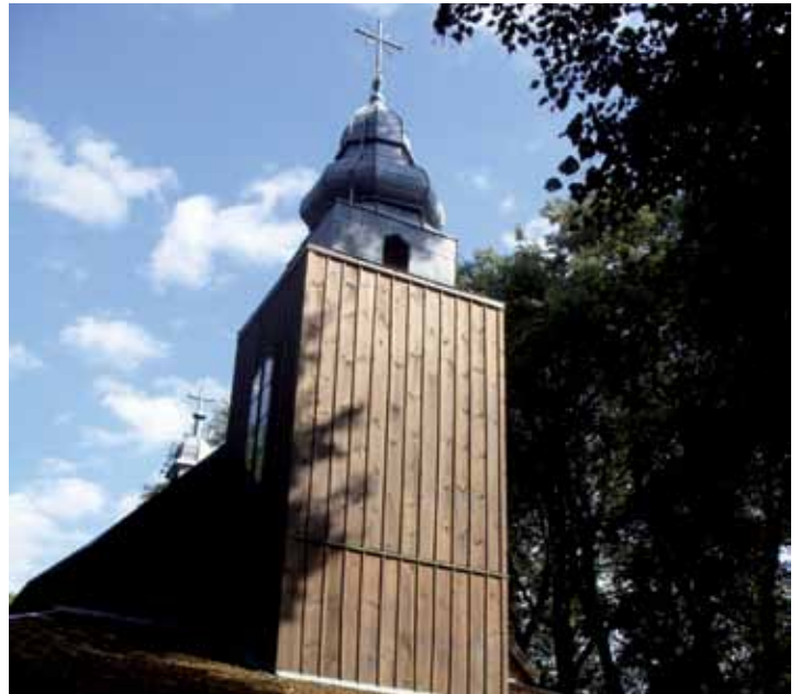
Zwieńczona krzyżem wieża kościoła z sygnaturką.