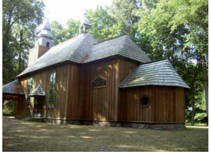
Widok kościoła od strony zakrystii i prezbiterium.