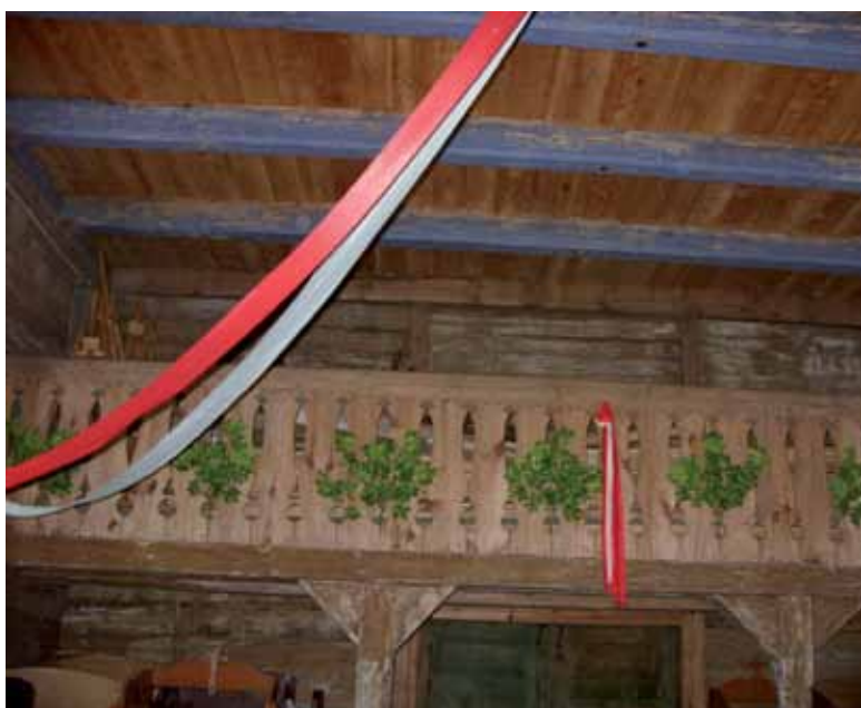
Widok na chór.