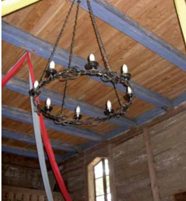
Wnętrze kościoła – widok na sufit.

Poważny remont kościółka przeprowadzono w 1933 roku, kiedy to założono nowy dach. Kolejne prace remontowe prowadzono w latach 1950-1953 oraz na większą skalę na przełomie XX i XXI wieku. Na ten ostatni cel kościółek w Drogiszce otrzymał trzykrotnie dotacje od Mazowieckiego Urzędu Marszałkowskiego oraz Ministerstwa Kultury i Dziedzictwa Narodowego (m.in. w 2008 r. dotacja wyniosła 75 000 zł). W ramach programu Dziedzictwo Kulturowe, finansowanego przez Urząd Marszałkowski, w kościółku w pierwszym etapie wymieniono instalację elektryczną i podłogę w prezbiterium. Ponadto wzmocniono konstrukcję drewnianą budynku i wieży kościoła, wykonano prace murarskie i izolacyjne przy fundamentach. Wymieniono oszalowanie zewnętrzne kościoła deskami modrzewiowymi, pokrycie dachowe (gont) i wykonano prace dekarские. Prace przy wymianie gontu mieli wykonywać górale, ale ze względów oszczędnościowych zrezygnowano z tego (wykonała to miejscowa lokalna firma). Ponadto wykonano nową podłogę i wszelkie prace impregnacjne przy pomocy środków owado- i grzybobójczych. Przeprowadzono renowację drzwi głównych