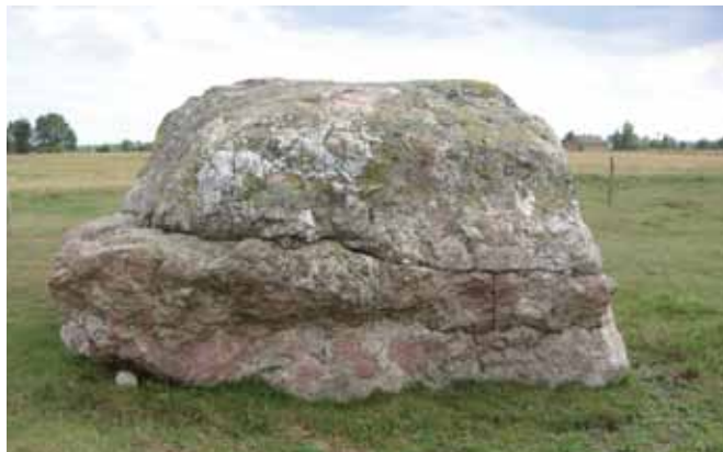
Kamień św. Franciszka.

i bocznych oraz część stolarki okiennej. Z uwagi na zagrożenie mykologiczne (grzyb), wykonano stosowną ekspertyzę, w której określono rodzaje środków zabezpieczających drewno.