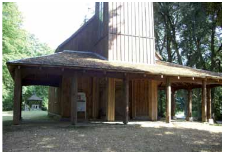
Podcienia przy wejściu głównym do kościoła.