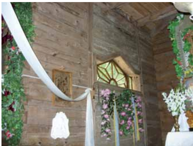
Fragment wnętrza kościoła.