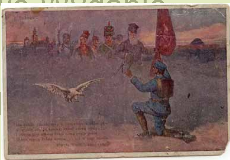
Kartka Piotra Słyszko z Łomży adresowana do ojca.