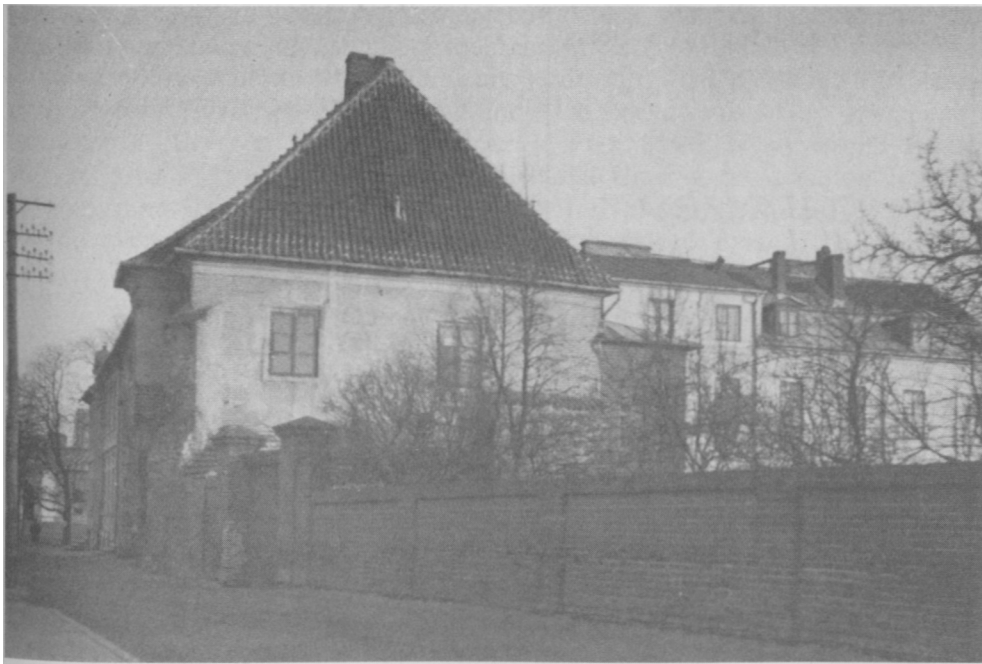
Budynek Towarzystwa Naukowego Płockiego, pl. Narutowicza 8 (d. Rynek Kanoniczny 8), fot. A. Maciesza, ok. 1930 r.