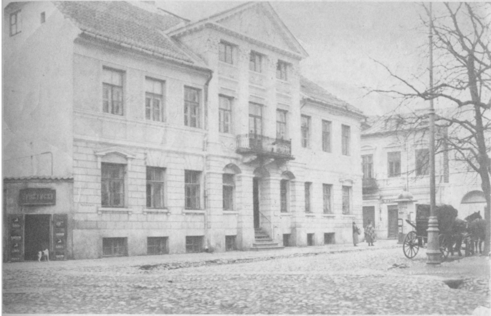
Dom pod Opatrznością, ok. 1930 r. – ówczesna siedziba Muzeum Mazowsza Płockiego