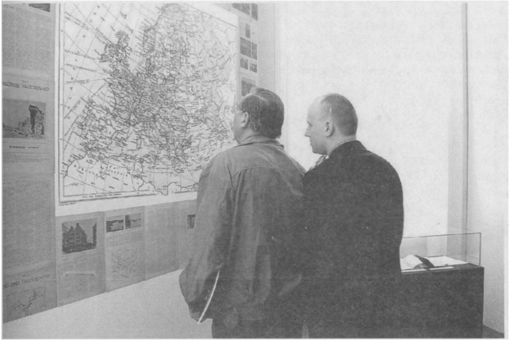
Przed brytyjską mapą Europy z 1919 r.