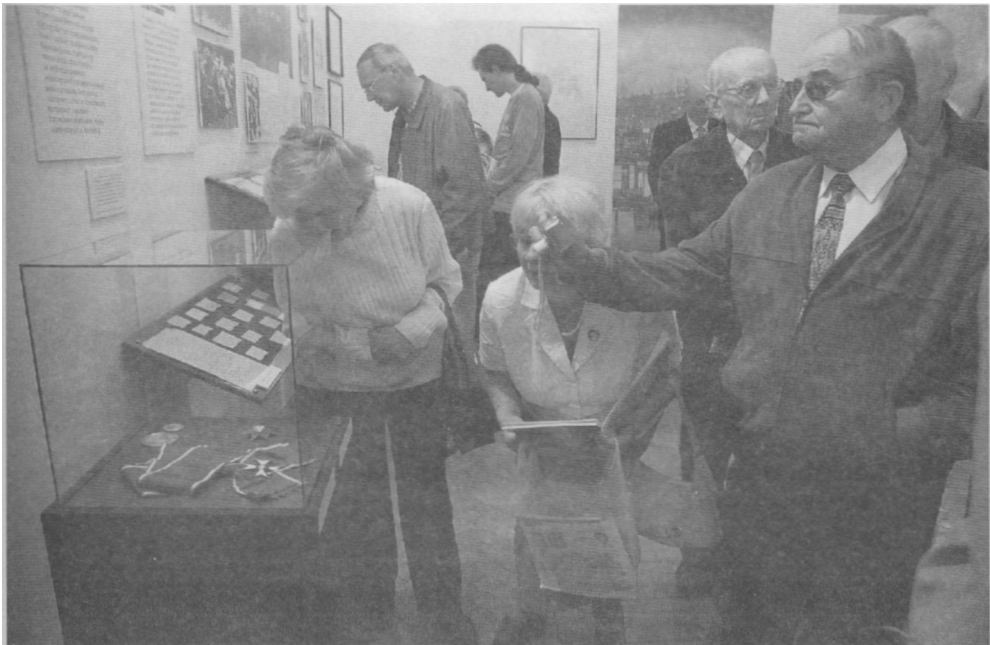
Uwagę zwiedzających przykuwał Order Polonia Restituta nadany Ignacemu J. Paderewskiemu w 1923 r.