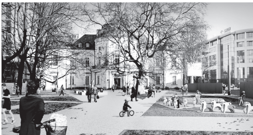
Rys 2. Aleja Centralna – Droga do Niepodległości z instalacją Ułani

Z Przystanku Muzeum Niepodległości, wyprowadzone zostaną dwie alternatywne trasy, umożliwiające dotarcie do wejścia głównego. Pierwsza z nich, Aleja Centralna/Droga do Niepodległości, umieszczona jest na osi założenia.