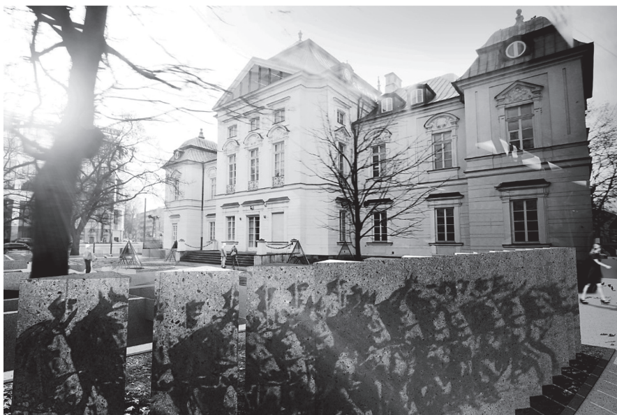
Rys 6. Miejska Wizytówka Muzeum Niepodległości od strony północno-wschodniej

tramwajowych oraz jezdni. Taka forma stałej ekspozycji, przyczyni się do zwiększenia komfortu akustycznego oraz zapewnienia bezpieczeństwa osobom przebywających na Skwerze Niepodległości.