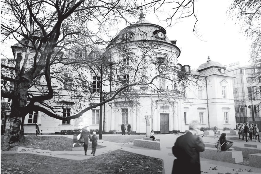
Rys 3. Końcowy fragment Drogi Bohaterów

Instalacją przestrzenną, znajdującą się bliżej wejścia do pałacu, będzie zabawka terenowa Ułani. Planuje się realizację dwóch układów po pięć rzeźb każda. Rzeźby, w postaci nowoczesnych w formie koników, ustawione będą w charakterystyczny dla kawalerii sztyk klinowy. Dzięki specjalnie dobranym gabarytom rzeźb, z zabawek będą mogły korzystać mniejsze dzieci.