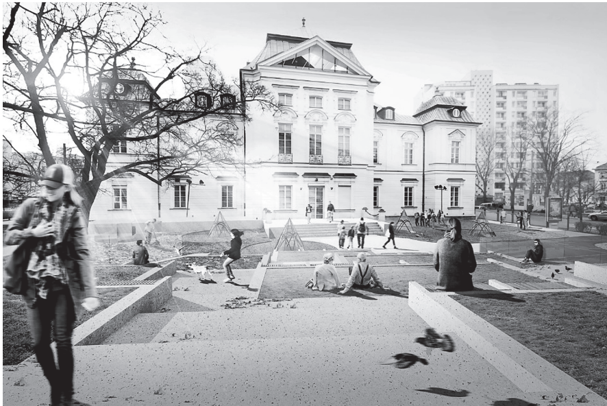
Rys 5. Część ogrodowa z amfiteatrem

Na zamknięciu części ogrodowej, tuż przed przejazdem, łączącym jezdnie alei „Solidarności”, przewidziano wykonanie zatoki dla autokarów. Wyposażona w pas rozdzielający, umożliwić będzie bezpieczne korzystanie z pojazdów. Dzięki bezpośredniemu skomunikowaniu z projektowanym wejściem ogrodowym, usprawni docieranie do obiektu, szczególnie w przypadku większej, zorganizowanej grupy odwiedzających.