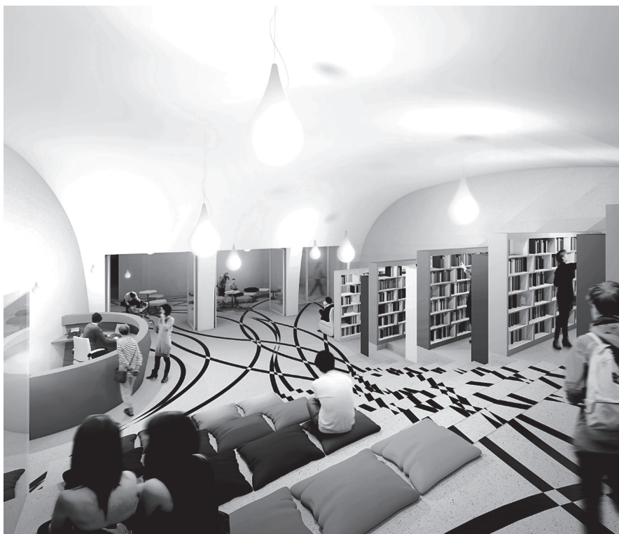
Rys 7. Czytelnia w pałacu

Przy wejściu dla niepełnosprawnych (północne wejście boczne), powstanie toaleta dla niepełnosprawnych oraz pomieszczenie biurowe dla szefa ochrony (dobra komunikacja z zespołem wejścia).