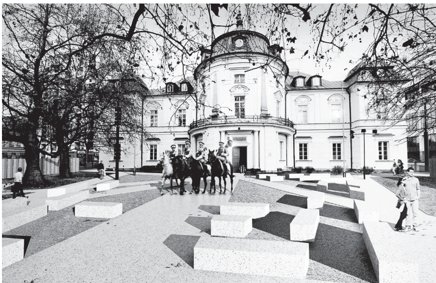
Rys 4. Plac wejściowy

Droga do Niepodległości oraz Droga Bohaterów, kończyć się będą na placu wejściowym, znajdującym się przez wejściem głównym do Muzeum Niepodległości. Zaprojektowano przestrzeń dostępną jedynie dla pieszych, całkowicie wolną od ruchu kołowego. Plac wyposażony w układ ławek ma być miejscem spotkania się grup wycieczkowych, punktem startowym odwiedzin wnętrza budynku. Plan przewiduje likwidację łącznika-przejazdu na przedpolu pałacu, co umożliwi oddanie całości terenu pieszym.