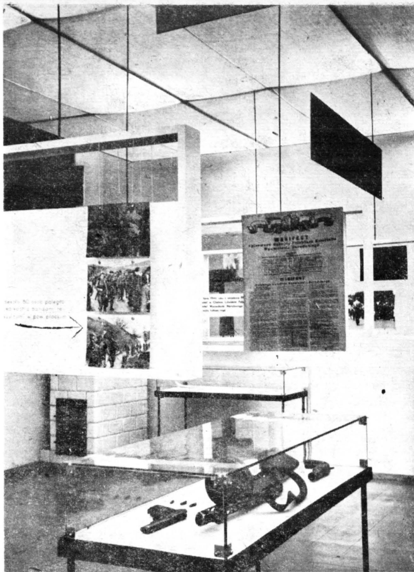
Wystawa XX-lecia PPR na Mazowszu Płockim. Fragment ekspozycji.

Wystawy poprzedzone były w wielu wypadkach badaniami własnymi Muzeum (XX-lecie PPR, „Kultura Ludowa Regionu Płockiego”), bądź badaniami prowadzonymi przez inne instytucje („Sztuka Mazowska Płockiego będąca fragmentem wystawy Muzeum Narodowego w Warszawie pt. „Sztuka Warszawska”).