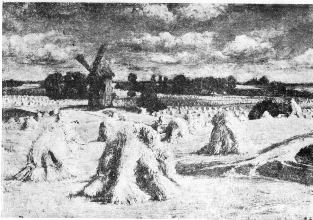
Żniwa. Obraz Cz. Idźkiewicza.