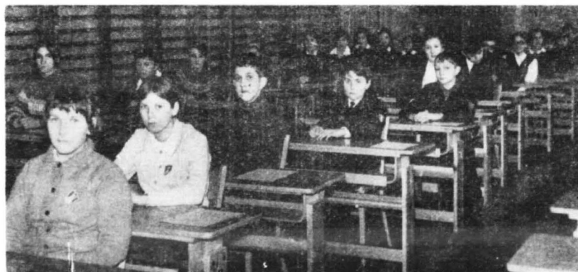
III etap eliminacji międzyszkolnych pionu szkół podstawowych w dniu 7.1.71 r.