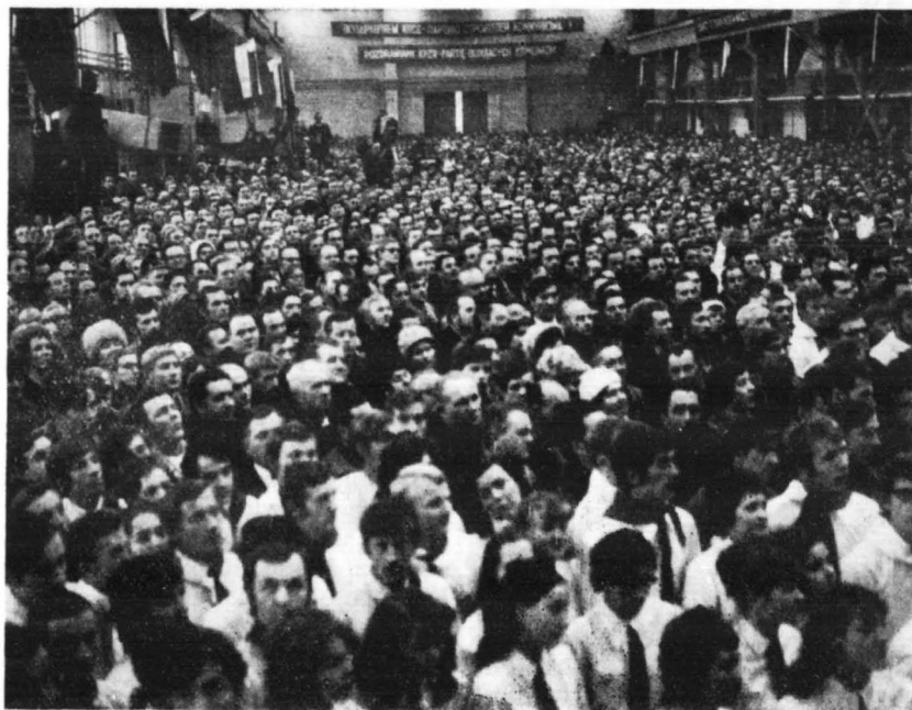
Okolo 4000 osób spotkało się z delegacją radziecką w wielkiej hali warsztatowej Mazowieckich Zakładów Rafineryjnych i Petrochemicznych, które dotychczas przerobiły 28,5 mln ton ropy płynącej od 1963 r. nieprzerwanie ropociągami „Przyjaźń” z dalekiej radzieckiej ziemi.

dziecka to już nie postulat, nie pusty dźwięk, ale rzeczywistość radzieckiego i polskiego zwykłego dnia. Taki był sens i wymowa tych słów, które padały z ust Piotra Maszerowa w ludnej hali MZRiP.