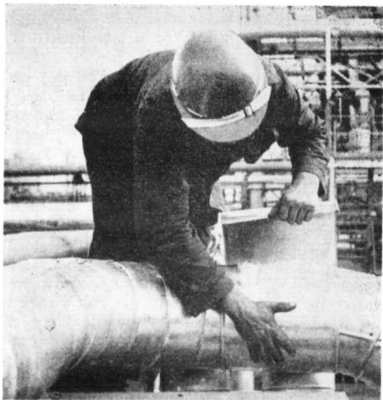
Montaż izolacji ciepłochronnej rurociągu doprowadzającego parę do instalacji butadienu.

Srodkowe położenie Płocka w kraju, w niedalekiej odległości od Warszawy — i lokalizacja PRTiA „Izokor-Instal”, którego dyrektorem jest przewodniczącym Ogólnokrajowej Podbranży Izolacji Termicznych i Antykorozyjnych, organizującej w Płocku branżowy ośrodek szkolenia specjalistycznego — pozwala przypuszczać, że stolica Mazowsza w krótkim