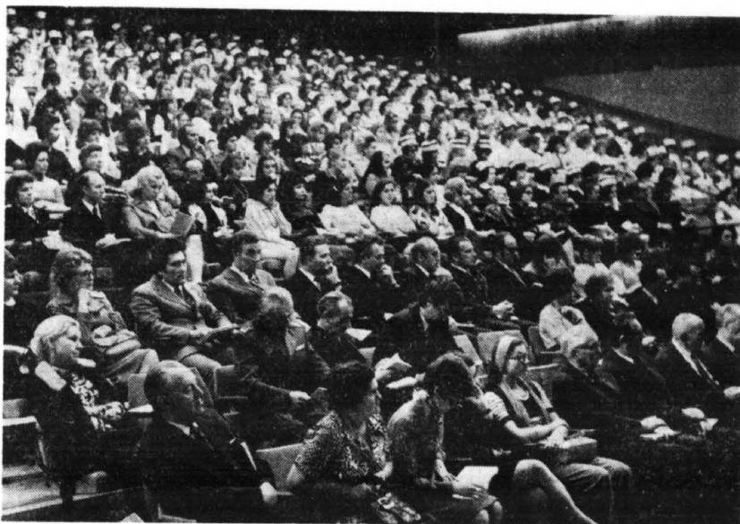
Fragment sali podczas jubileuszowych uroczystości Zespołu Szkół Medycznych

Drogie uczennice, Szkoła Wasza otrzymała dziś sztandar, odznaczona została Złotą Odznaką Województwa Warszawskiego, nadano jej imię prof. Marcina Kacprzaka, wielkiego człowieka, wspaniałego lekarza, a równocześnie wielkiego społecznika. Mam nadzieję, że będzie przewodził Wam w pracy, tutaj w szkole, przede wszystkim w pracy społecznej, a po tym, kiedy opuścicie mury tej szkoły, będziecie ucieleślały w życie jego idee. Szkoła Płocka wypuściła już wiele absolwentek, które zajmują kierownicze stanowiska. Wśród nich jest wiele działaczek naszego Polskiego Towarzystwa Pielęgniarskiego. Mam nadzieję, że Wy opuszczając tę Szkołę, zasilicie nasze szeregi i będziecie razem pracowały z nami nie tylko zawodowo, ale i społecznie.