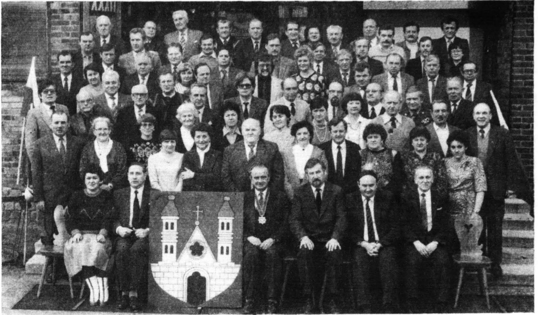
Radni Miejskiej Rady Narodowej w Płocku w latach 1984—1988 obecni na Sesji MRN w dniu 10 lutego 1987 r.

wych Komitetu Organizacyjnego, koncentrujące wysiłki i zaangażowanie na rzecz możliwie pełnego wykonania zadań programowych.