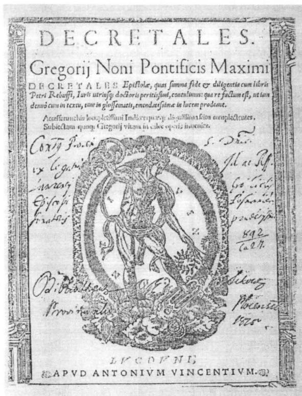
Karta tytułowa "Decretales. Gregorij Noni Pontificis Maximi." W zbiorach Biblioteki im. Zielińskich TNP, sygn. XVI/744