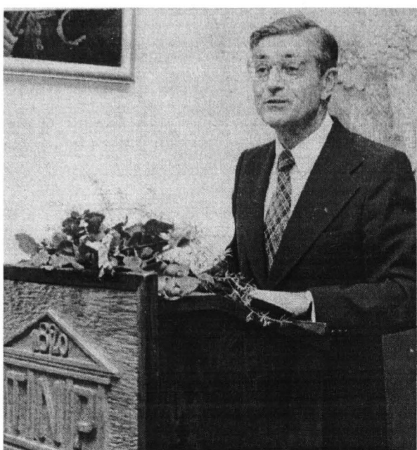
Fotografia sprzed 21 lat. Profesor Aleksander Gieysztor wygłasza w sali im. Tadeusza Gierzyńskiego w dniu 17 października 1975 r. wykład nt. "Urząd wojewódzkiński w Polsce i na Mazowszu".

mówiąc, że są 3 rodzaje Płocczan: Płocczanie z dziada pradziada, Płocczanie z wyboru i skierowani losem do tego miasta, wreszcie Płocczanie - korespondenci. Tacy co mieszkają poza tym miastem, ale są nim przejęci, ciekawi jego zmian i pełni uznania dla ciągłości jego życia. Odwiedzają je możliwie często i w miarę swoich możliwości próbują przyczynić się do jego powodzeń.