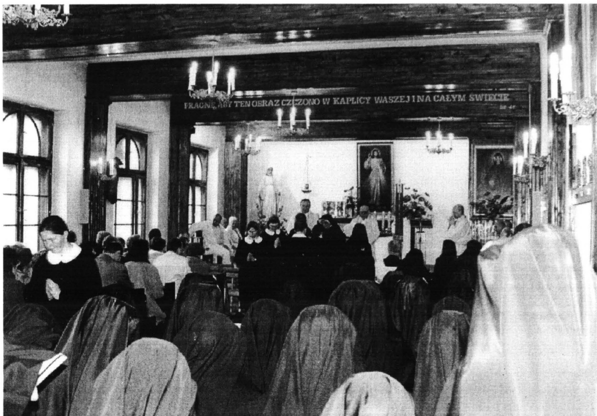
Płock, Kaplica Miłosierdzia Bożego w dniu uroczystości.

"Jezu ufam Tobie". Właśnie tu w klasztorze przy Starym Rynku 14-18, s. Faustyna miała 22 lutego 1931 r. pierwsze objawienie Pana Jezusa i otrzymała posłannictwo głoszenia Bożego Miłosierdzia dla świata całego.