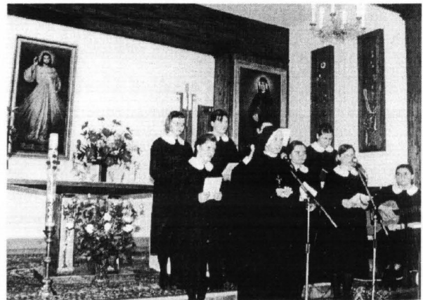
Płock - Kaplica Miłosierdzia Bożego, siostry zakonne.

Po Mszy świętej odbył się program słowno-muzyczny w wykonaniu sióstr zakonnych w oparciu o "Dzienniczek - Miłosierdzie Boże w duszy mojej" bł. s. Faustyny Kowalskiej.