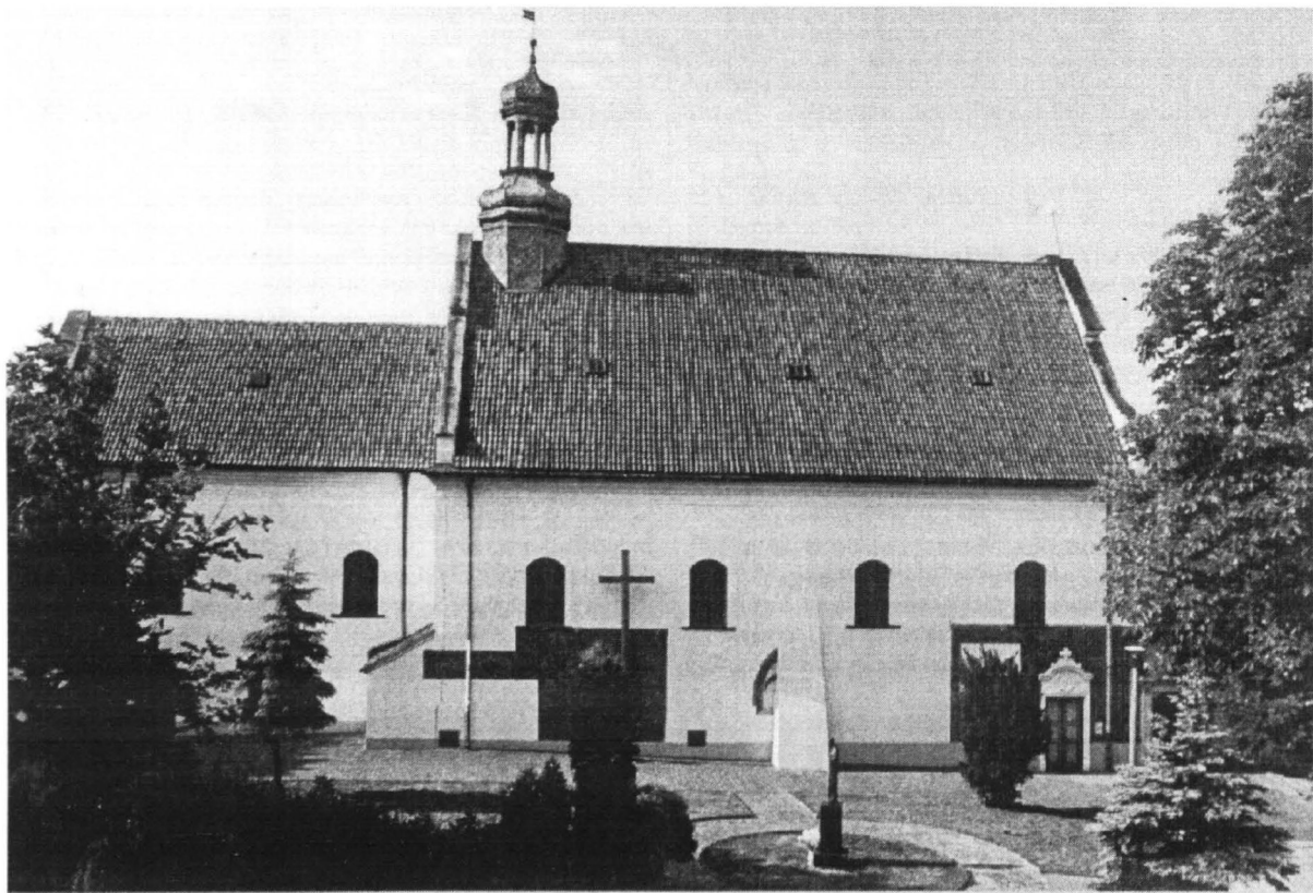
Kościół "Na Górkach" zbudowany w 1234 roku za panowania księcia płockiego Konrada I, w roku 1804 przekazany został luteranom przez władze pruskie na parafię ewangelicko-augsburską.

W odniesieniu do Płocka ów dorobek jest nieporównanie mniejszy. Problematykę obecności ludności wyznania ewangelicko-augsburskiego podnoszono w monografii: "Dzieje Płocka" pod red. A. Gieysztor, monografii historycznej arcybiskupa A. J. Nowowiejskiego - "Wspomnieniu jubileuszowym z okazji 125 rocznicy założenia parafii w Płocku" pastora A. Gundlacha czy w "Opisach miast polskich z lat 1793-1794" J. Wąsickiego. 2 Spośród pozycji źródłowych wart odnotowania jest "Topographisch - statistische Nachrichten von der Königlichen Immediat Stadt Plock... 1802". Ubóstwo prac dotyczących luteran płockich nie ma przełożenia na liczbę źródeł archiwalnych, które oczekują na ich opracowanie. Mam tu na myśli przede wszystkim Księgi Metrykalne parafii ewangelicko-augsburskiej w Płocku, które stanowią kopalnię wiedzy nie tylko dla badaczy zajmujących się problematyką demografii, ale również