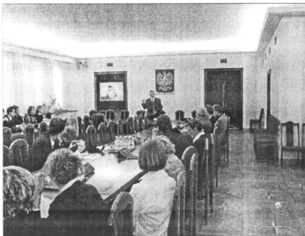
Prezes TNP, senator RP Zbigniew Kruszewski podczas spotkania z młodzieżą ze szkół kopernikańskich.