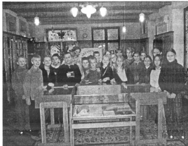
Wystawę w Płocku obejrzało około 2000 osób.