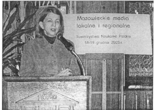
Julia Pitera - Prezes Transparency International.