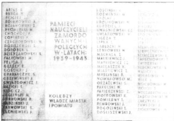
Tablica pamiątkowa z 77 nazwiskami nauczycieli z miasta i powiatu pomordowanych w latach 1939-1945

Po zebraniu danych osobowych, dokumentów i innych materiałów dotyczących martyrologii nauczycieli postanowiono ufundować pamiątkową tablicę z nazwiskami i wmurować ją w holu Domu Nauczyciela. Do tej akcji poza członkami Związku włączyła się również młodzież ze szkół średnich, zbierając na ten cel datki. Uroczyste odsłonięcie tablicy z wrytymi nazwiskami nauczycieli z miasta i powiatu nastąpiło 13 października 1973 roku 11 .