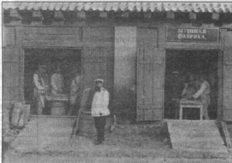
Więźniowie podczas pracy w warsztacie budowlanym - początek XX wieku

Od 1 lipca 1886 roku na podstawie zatwierdzonego przez władze administracyjne Królestwa Polskiego zarządzenia z dnia 6 stycznia 1886 roku wprowadzono we wszystkich więzieniach obowiązkowe roboty. Zgodnie z przyjętym założeniem dochód z tych prac miał obniżyć kwoty wyasygnowane na utrzymanie więzień. W płockim zakładzie karnym w latach 1886-1912 średnia suma dochodów z prac aresztanckich wynosiła 1.720 rubli 45 kopiejek rocznie, najniższa była w 1907 roku – 733 ruble 321 kopiejki, a najwyższa już w 1912 roku – 3.246 rubli 21 kopiejek 15 .