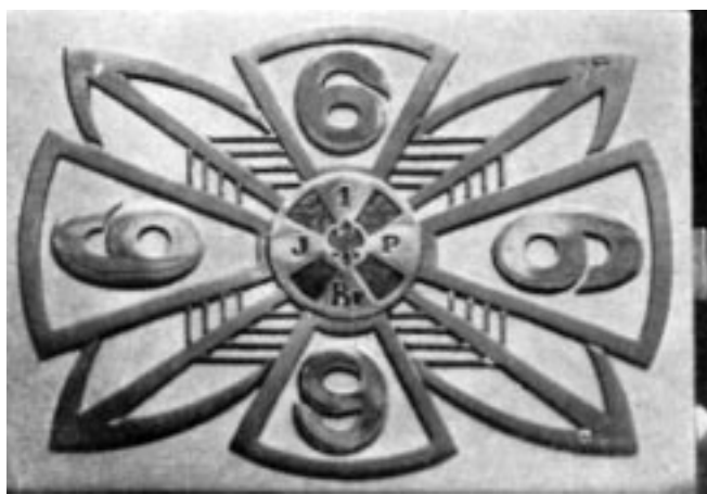
Rys. 17. Pamiątkowa srebrna papierośnica 6 p. p. leg 30