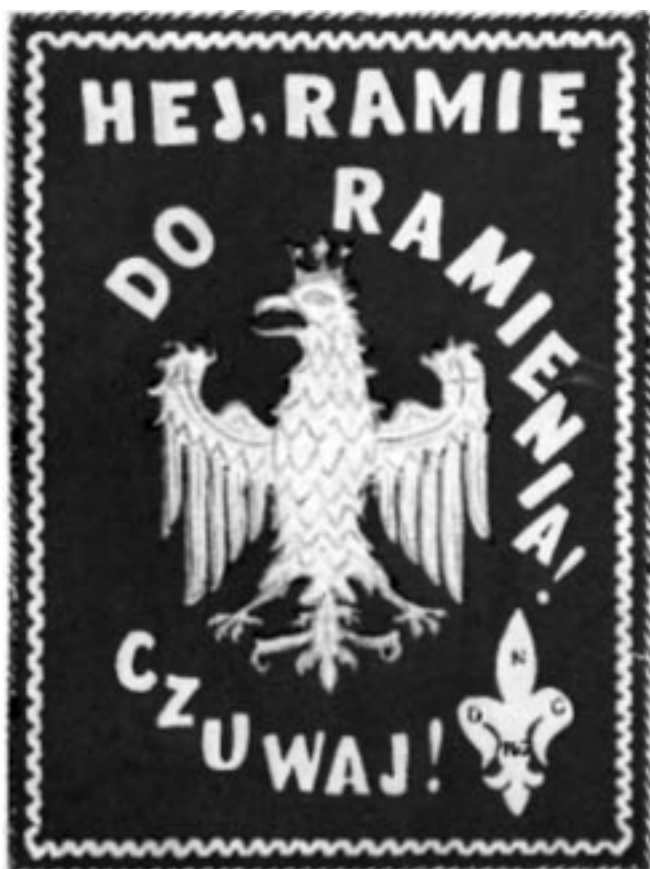
Rys. 13. Lewa i prawa strona sztandaru skautowskiego 22

W 1919 roku Ministerstwo Spraw Wojskowych zgodnie z uchwałą sejmiku z dnia 1 sierpnia o godle i barwie Rzeczypospolitej Polskiej określiło wzór sztandaru wojskowego. Warszawski sztandar 6 pułku piechoty legionów stał się nieprzepisowy. Z