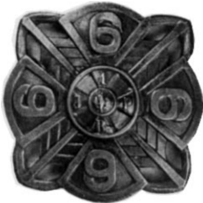
Rys. 15. Odznaka pamiątkowa 6 pułku piechoty legionów ustanowiona w 1929 roku 28

11 kwietnia 1929 roku Korpus Oficerski pod przewodnictwem dowódcy pułku płk Stefana Biestka postanowił ustanowić nową odznakę pułkową. Przyjęto projekt kpt. Bronisława Sylwina Keneboka z 1 pułku piechoty legionów. Odznaka miała kształt 4 strzał-wici i 4 tarcz toporów z cyfrą pułku. W środku na tarczy wstawiono krzyż z orłem z odznaki 1 brygady Józefa Piłsudskiego. Jako wzór do projektu posłużyła pieczęć kanonika wrocławskiego Zbrostawa z 1276 roku. Projekt ten został przyjęty przez wszystkie pułki 1 Dywizji Piechoty Legionów, z odpowiednią zmianą cyfr na tarczach. Odznaka została zatwierdzona przez Marszałka Polski Józefa Piłsudskiego i miała być wykonywa-