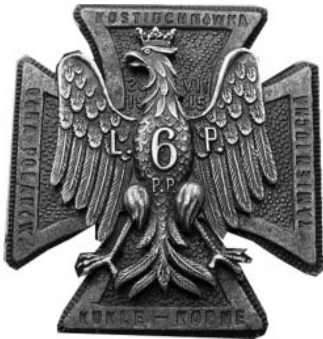
Rys. 10. Krzyż pamiątkowy 6 pułku piechoty legionów polskich „Za wytrwałą służbę w pułku” 18

W zimie 1916 roku w czasie walk pod Optową ptk Norwid zaproponował ustanowienie krzyża pamiątkowego „Za wytrwałą służbę w pułku”. Powstało kilka projektów, z których po poprawkach przyjęto wersję ppor. Jana Zatuskiego. Odznaka przyjęła formę krzyża oksydowanego z żelaza. W centralnej jego części rozpostarty srebrny orzeł z koroną mający na piersi cyfrę 6, a niżej litery PP. Na lewym skrzydle litera „L”, na prawym „P”. Na