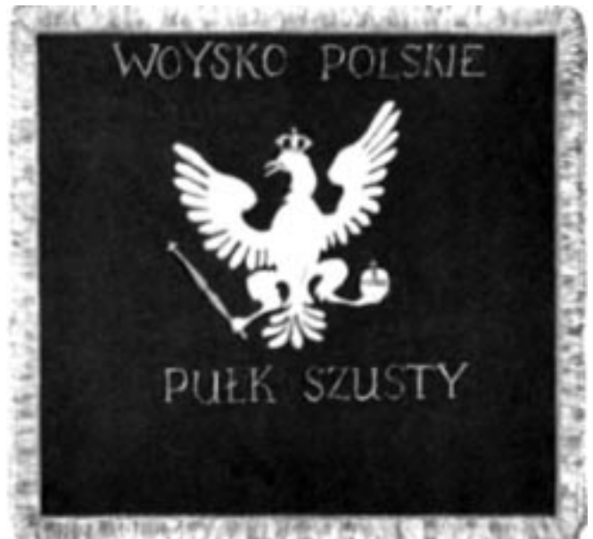
Rys. 3. Lewa i prawa strona chor gwii przyznanej 6 pułkowi piechoty przez Ksi cia Józefa Poniatowskiego w 1809 roku 5 . (Chor gwii wykonana była z jedwabiu koloru karmazynowego długo ci 53 i szeroko ci 50 centymetrów. Na płacie widoczny koronowany orzeł biały z insygniami królewskimi w szponach i napisy: WOYSKO POLSKIE, PÓŁK SZÓSTY i PUŁK SZUSTY na stronie odwrotnej)