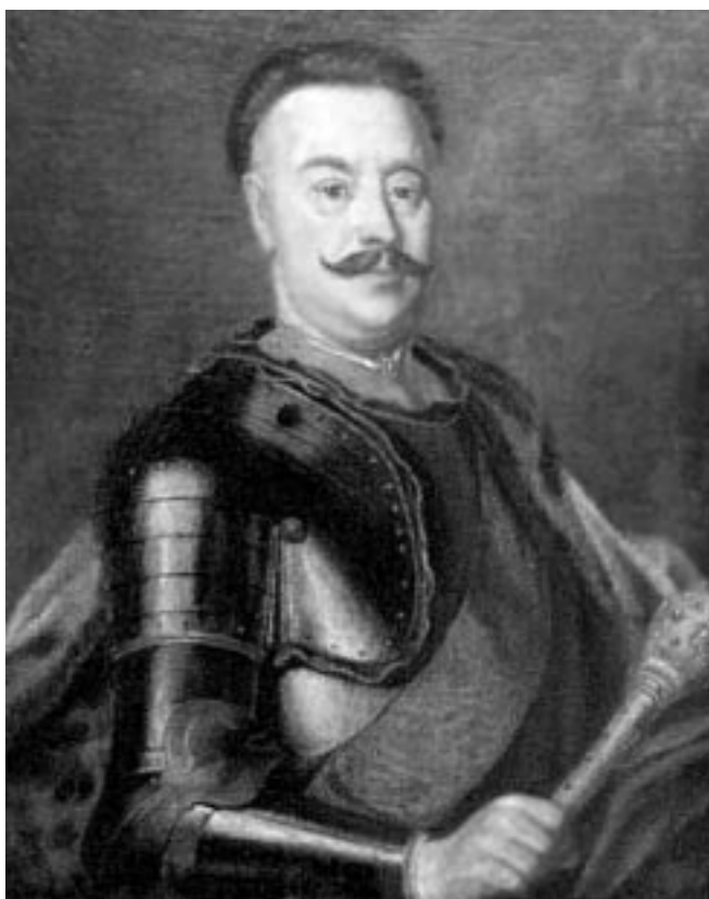
Rys. 1. Hetman Jan Klemens Branicki 2