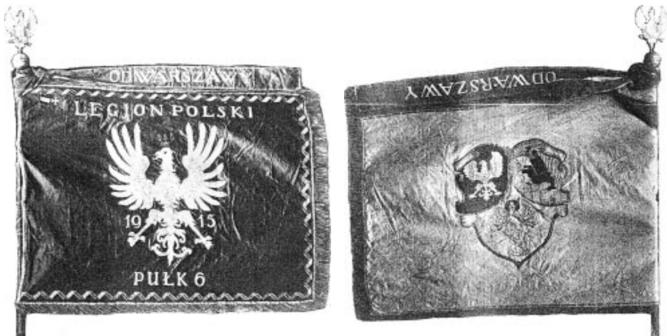
Rys. 5. Lewy i prawy płat sztandaru z 1915 roku. (Płat chorągwiowany miał długość 132 cm i 100 cm szerokości, z jednej strony amarantowy, z drugiej biały. Wykonany z jedwabiu. Na środku strony amarantowej wyhaftowany biały orzeł ze złotą koroną, nad orłem napis „LEGION POLSKI”, pod spodem „PUŁK 6”, pod skrzydłami orła, a nad jego szponami „1915”. Cały skraj strony amarantowej obszyty wężykiem legionowym srebrnym. Na stronie białej pośrodku pola wyhaftowany herb wspólny Polski, Litwy i Rusi. Kraje płatu z trzech stron obszyte srebrnymi frędzlami) 9

Płat chorągwi umieszczony był na drzewcu długości 322 centymetrów o średnicy 4 centymetrów, zakończonym srebrną kulą, a na niej umieszczonym posrebrzanym płaskim orłem wysokości 21 centymetrów. Przy kuli umocowano dwie jedwabne szarfy amarantowe z jednej strony i białe z drugiej. Na szarfi o długości 121 centymetrów na amarantowym polu widniał biały