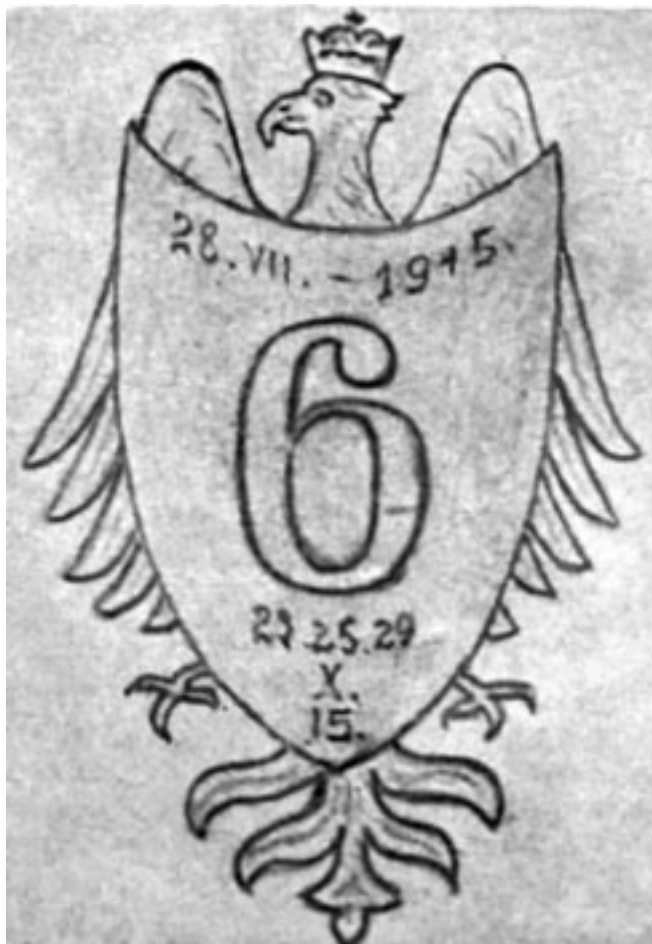
Rys. 9. Projekt odznaki 6 pułku piechoty legionów polskich 17