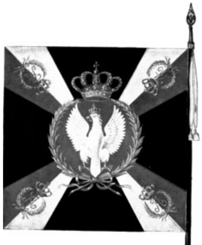
Rys. 4. Chor gwii 6 pułku piechoty z 1815 roku 6 . (Na płacie duży koronowany orzeł biały na karmazynowym polu otoczony wieńcem laurowym i całość zwieszona królewską koroną. Promienie rozchodzące się biało-czerwone szarfy z inicjałami cesarza Rosji Aleksandra I)

Po Kongresie Wiedeńskim w 1815 roku i utworzeniu Królestwa Polskiego z cesarzem Rosji jako