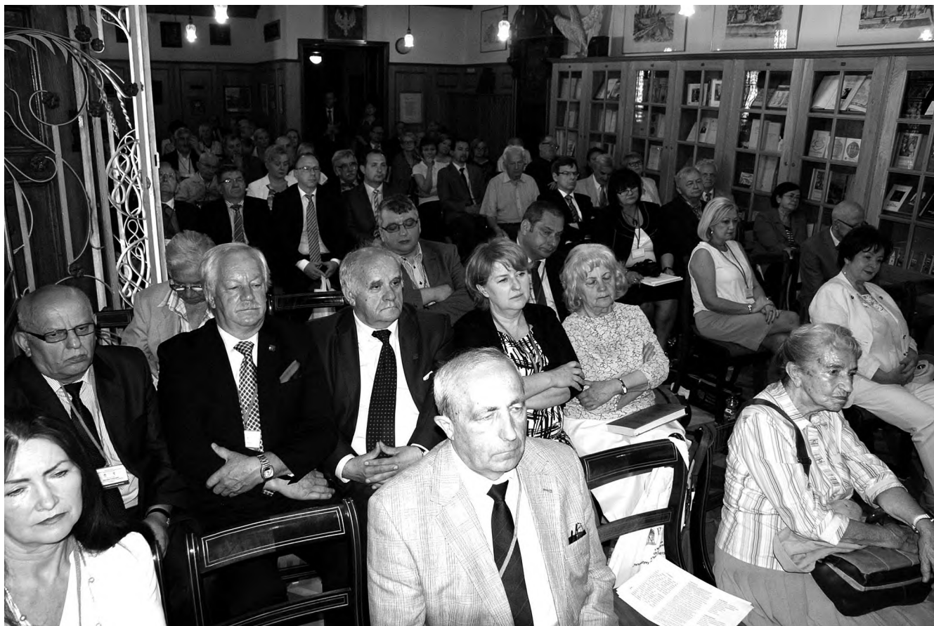
Konferencja naukowa pt. Perspektywy regionalnych towarzystw naukowych w Polsce , sala obrad