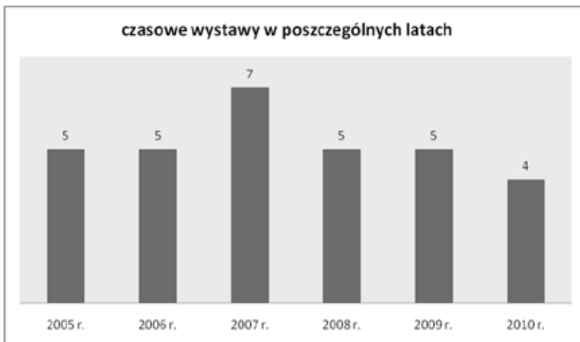
Wykres 2. Wystawy czasowe w Muzeum w Pieniężnie

Sprawozdania z pracy Muzeum (2004-2010), Archiwum Muzeum Misyjno-Etnograficznego w Pieniężnie, mps