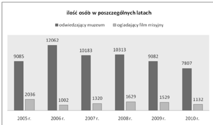
Wykres 1. Goście odwiedzający Muzeum Misyjno-Etnograficzne w Pieniężnie

Sprawozdania z pracy Muzeum (2005–2010), Archiwum Muzeum Misyjno-Etnograficznego w Pieniężnie, mps