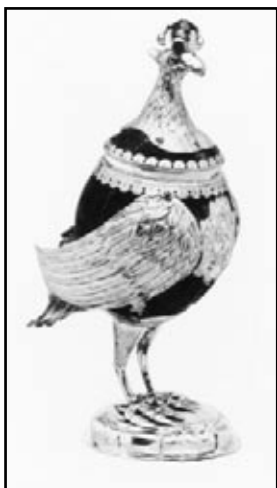
Barokowy pucharek w kształcie orła, I poł. XVII w.

Charakterystycznym obrazem tamtych czasów były też pijatyki sejmikowe. Zjeżdżającą na nie szlachtę pojonono dużymi ilościami alkoholu. Mocno podchmieleni obywatele byli łatwiejsi do przekonania o słuszności koncepcji reprezentowanej przez możnego sponsora całej pijatyki.