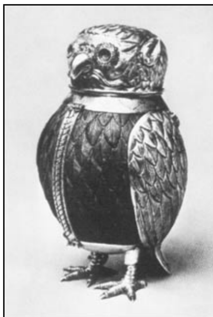
Pucharek w kształcie sowy, II poł. XVII w.

Nie wszyscy w państwie polskim byli opojami. Niemal wszyscy jednak przez długie stulecia ulegali modzie na upijanie się podczas uczt. Pijaństwo niosło ze sobą wiele „guzów i plastrów” co zauważał już Jan Kochanowski. Prowadziło do zwad, bijatyk, utraty pieniędzy i zdrowia (można było wrócić z biesiady bez nosa lub ucha, o czym donoszą nam pamiętnikarze). Przysparzało prymitywnej zabawy, ale i kłopotów – łatwo było przy ograniczonej świadomości umysłu zdradzić jakiś sekret. Przestrzegali przed nim moralisci i pisarze. Dopóki jednak aprobowali je najważniejsi ludzie w kraju – król, magnaci – trwało w rozkwicie. Przełomem stało się dopiero panowanie Stanisława Augusta Poniatowskiego, który pijaństwem się brzydził. Postawa władcy i jego najbliższej rodziny wpływała na społeczeństwo. Warstwy wyższe odchodziły stopniowo od tak rażących cudzoziemców obyczajów w zakresie nadużywania trunków. Przewartościowaniu ulegał model gościnności. Wkrótce państwo polskie miało zniknąć z map i trzeba było mieć doprawdy „trzeźwą” głowę, by nie zatracić istoty polskości, kiedy samo państwo już zatracono. ■