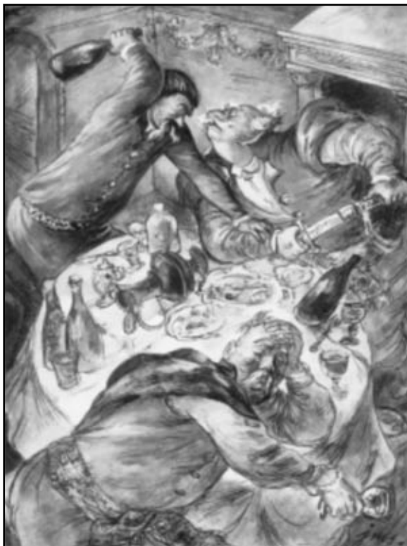
Ilustracja J.M. Szancera do satyry „Pijaństwo” Ignacego Krasickiego. |

Od połowy XVII wieku nasiliła się tendencja organizowania znacznie hałaśliwszych, wręcz awanturnicznych imprez, na których przymuszanie do picia było egzekwowane ze szczególną żarliwością. Podany kielich należało wychylić do dna, w innym przypadku był ponownie uzupełniany. Barwnie przedstawia taką sytuację Jędrzej Kitowicz w książce Opis obyczajów za panowania Augusta III . „U niektórych panów lokaje, hajducy (...) mieli rozkaz raz na zawsze podczas uczty pilnować, kto nie wypił, aby mu dolano; na ten koniec służebni domowi jedni się porozsadzali z flaszami dokoła stołu, drudzy z tymi pod stół powłazili. Jeżeli nie wypijający kielicha swego, broniąc się od dolewki sąsiada, wyniósł go w górę albo za siebie uchylił, pacholek na to czatują-