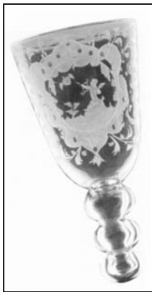
Kielich - kulawka, XVIII w.

cy sprawnie mu go dolał; jeżeli skrył go pod stół, to samo zrobił mu siedzący pod stołem służka. I tak ów niedoleźny pijak, który nie mógł duszkiem wygarnąć kielicha, kręcił się jak wąż tam i sam, w górę i na dół z kielichem, a wszędzie mu go