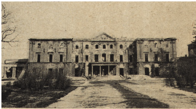
Ryc. 57. Białystok, dawny pałac Branickich, widok od strony parku.

W najstarszej części pałacu zachowały się sklepienia, część rzeźb i balustrad. W r. 1945 odgruzowano pałac, zabezpieczono rzeźby i podstemplowano zagrożone ściany. Okna parteru zamurowano, a na piętrze zaszalowano deskami. W następnym roku przykryto główny budynek dachem prowizorycznym na więzaniach dwuteowych i przykryto go papą bitumiczną. Następnie odgruzowano skrzydła pałacu. W r. 1947, po rozbiórze części zagrożonych, zrekonstruowano mu-