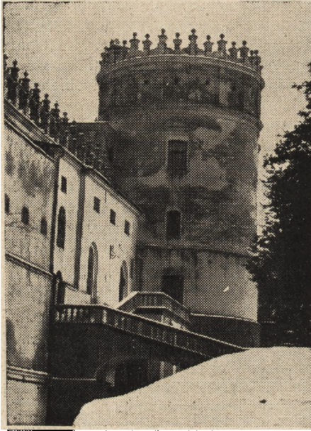
Ryc. 60. Krasieczyn, baszta Królewska.

i drzwi; marmurowe ściany baszty papieskiej wypalily się na wapno, runął wtedy dach wieży zegarowej. Po tym pożarze przystąpiono do prac konserwatorskich, które trwały do roku 1939. W czasie działań wojennych w latach 1939—1944 zamek ucierpiał z powodu zakwaterowania się tam uchodźców, którzy znisz-