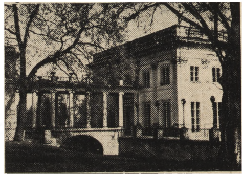
Ryc. 61. Warszawa, Łazienki, galeria zachodnia po usunięciu oszklenia.