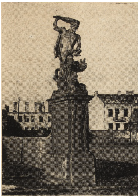
Ryc. 58. Białystok, dawny pałac Branicznych, figura Herkulesa.