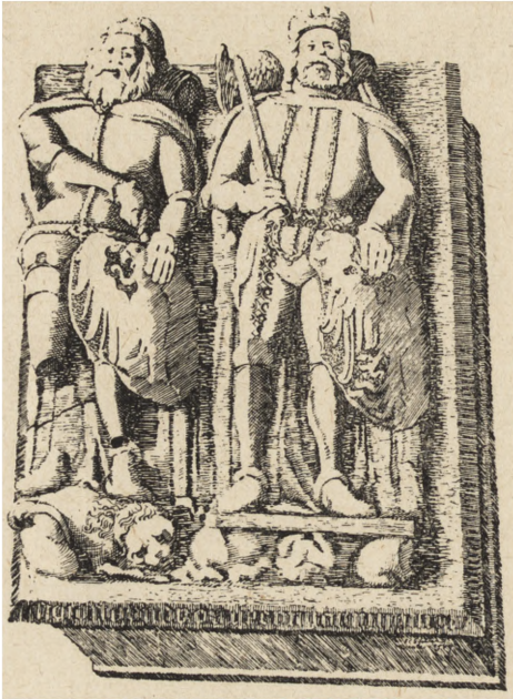
Ryc. 70. Sarkofag Piastów Opolskich w kościele franciszkańskim — Bolko I i Bolko II, wiek XIV.

że sarkofagi zostały wykonane po jej, a przed jego śmiercią, gdyż są poza tym obydwaj jednego typu, i wyglądają jakby wykonane w jednej pracowni.