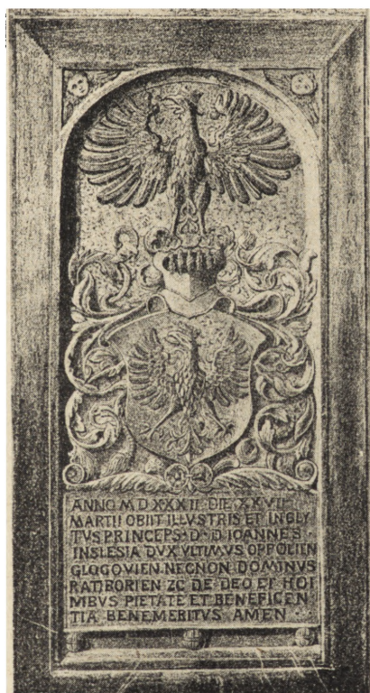
Ryc. 74. Płyta grobowa księcia opolskiego Jana II (zm. 1532 r.), w kościele św. Krzyża w Opolu.

Pozostaje nam jeszcze jedna sprawa do poruszenia, sprawa daty wykonania sarkofagów piastowskich w kościele franciszkanów w Opolu. Czy wobec zasadniczej różnicy w kształcie orłów herbowych nie zostały one wykonane w różnym czasie? Rzeźbiarz, czy rzeźbiarze, starali się wprawdzie (jak już wspomniałem), utrzymać pewną indywidualność poszczególnych rzeźbionych figur, urozmaicili też akcesoria, tudzież różnice w ozdobach pasów, klamer itp. — ale czy te urozmaicenia miałyby się posunąć aż do zmienienia kształtów orłów herbowych? Zagadnienie to należy rozpatrzyć szerzej, przy opracowywaniu grobów i sarkofagów piastowskich w Opolu. Może zresztą odnajdą się i jakieś inne bliższe dane, odnoszące się do tych sarkofagów, i rozstrzygną tę sprawę. W archiwach np. w Pradze, powinno się w ogóle znaleźć wiele materiałów do naszych dziejów Opolszczyzny, nie wyzyskanych i nie poruszanych jeszcze nawet.