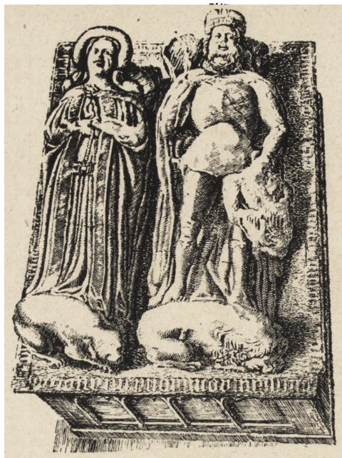
Ryc. 72. Sarkofag Piastów Opolskich w kościele franciszkańskim — Bolesław III i jego żony Anny (wiek XIV).

a) Orzeł z zamku . Znajduje się obecnie w Państwowym Muzeum w Opolu. Rzeźbiony wypukło w ciemnym piaskowcu. Tarcza trójkątna, o bokach lekko wypukłych. Wys. 41 cm, szer. u góry 36.5 cm, w miejscu najszerszym 39,5 cm. Orzeł w koronie złoty, na niebieskim polu. Głowa orła zadzierżycie odchylona, dziób otwarty z wysuniętym językiem. Skrzydła podniesione, z wyraźnie oddzielanymi, w dół opuszczonymi piórami, z których dwa są szczególnie długie i wypełniają puste przestrzenie tarczy. Na kolankach skrzydeł charakterystyczne, esowate wyrostki pojedyncze, podobne do wyrostków na tarczy Bolesława III. Nogi silne, rozstawione, ze szponami. Ogon stylizowany.