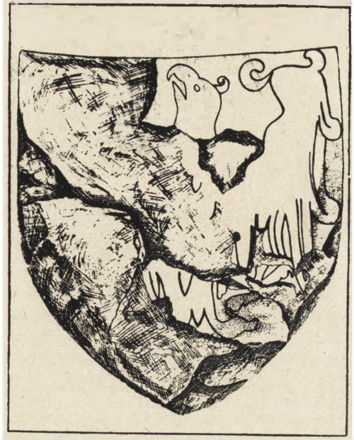
Ryc. 73. Tarcza z pomnika Bolesława III.

Siedem powyższych orłów piastowskich, znajdujących się w Opolu, podzielić możemy na następujące typy: