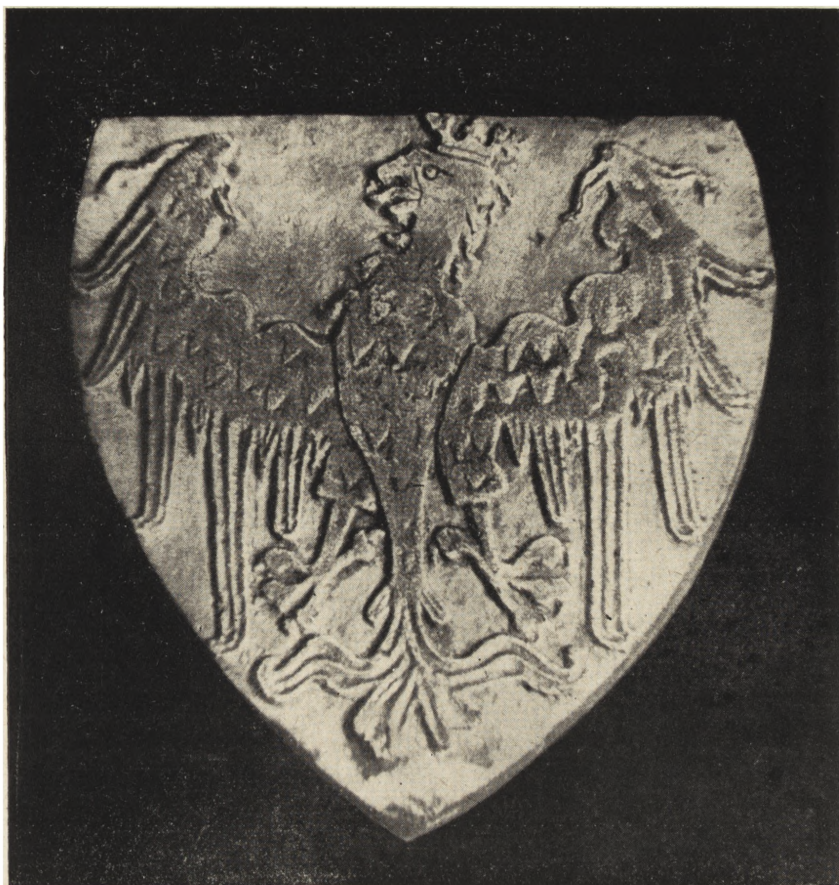
Ryc. 69. Orzeł ze zwornika z sali Zamku Piastowskiego „na wyspie”.