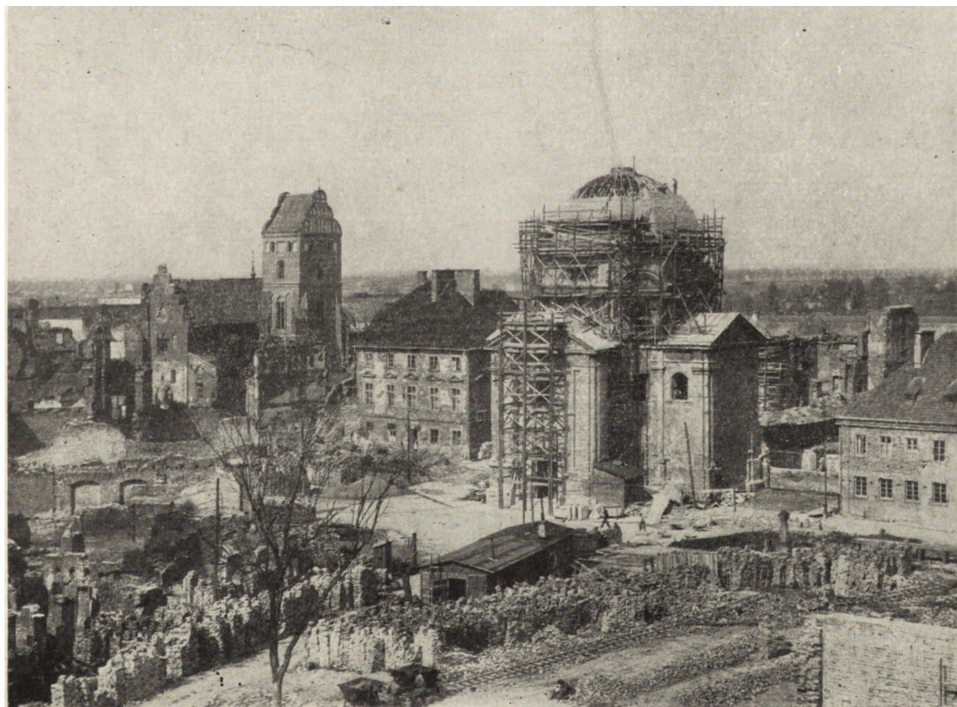
Ryc. 80. Warszawa — Rynek Nowego Miasta. Kościół pp. Sakramentek w odbudowie. W głębi kościół N. M. P. Stan z maja 1951.

ren na planie krzyża równoramiennego, dotrwał bez żadnych przeróbek do 1944 r. Kopuła jego, obok dzwonnicy kościoła N. M. P., stanowiła tak charakterystyczny akcent na wszystkich panoramach Warszawy.