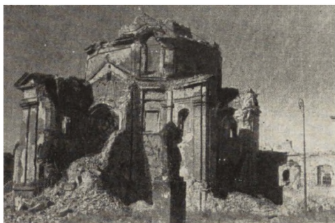
Ryc. 78. Warszawa — Rynek Nowego Miasta. Kościół pp. Sakramentek. Stan zniszczenia w r. 1945.