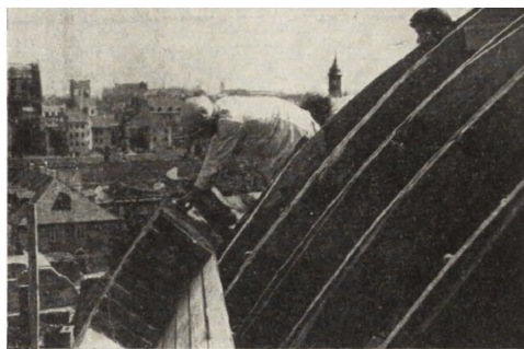
Ryc. 79. Warszawa — Murowanie kopuły kościoła pp. Sakramentek. Stan z maja 1951 r.

Kościół pp. Sakramentek na Nowym Mieście w Warszawie, wzniesiony w 1688 do 89 r. w/g projektu Tylmana z Game-