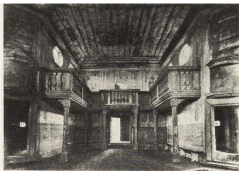
Ryc. 189. Wełna — kość. drewniany. Widok na część chórową przed konserwacją. Ze zb. P. K. Z.