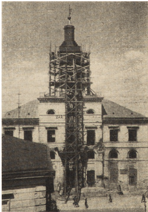
Ryc. 307. Lublin — Nowy Ratusz przy pl. Lokietka. Odbudowa wieży. Stan z r. 1950.