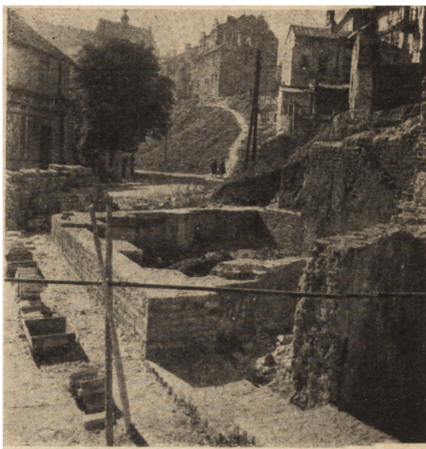
Ryc. 288. Lublin — kamienica przy ul. Grodzkiej 23. Stan z r. 1952.

Lublin — Brama Grodzka i jej otoczenie. Prace rozpoczęto już w roku 1946 zabezpieczeniem przez nakrycie stropem żelbetowym i nowym dachem — Bramy Grodzkiej. Dziś w budynku tym, choć nie odrestaurowanym całkowicie, mieści się pracownia rzeźbiarska Liceum Sztuk Plastycznych. Sąsiadujący z Bramą Grodzką budynek przy ul. Kowalskiej 17, pochodzący z XVIII w., zagrożony w swym istnieniu poważną awarią budowlaną w roku 1946, został zabezpieczony wstępnie w roku 1949, obecnie zaś odbudowywany jest na cele mieszkalne; przywraca mu się przy tym prawidłowe proporcje dachów i szczytów. Budynek przy ul. Grodzkiej 23 (ryc. 288), jeden z XVIII-wiecznych „domów handlowych“ dzielni-