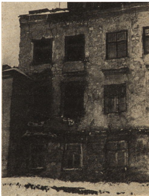
Ryc. 289. Lublin — kamienica przy ul. Jezuitkiej 21 po zniszczeniach wojennych. Stan z r. 1949.