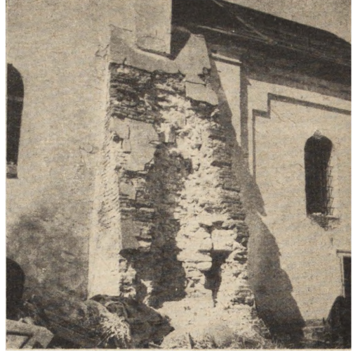
Ryc. 303. Szczepieszyn — cerkiew. Zniszczona skarpa. Stan z r. 1951.