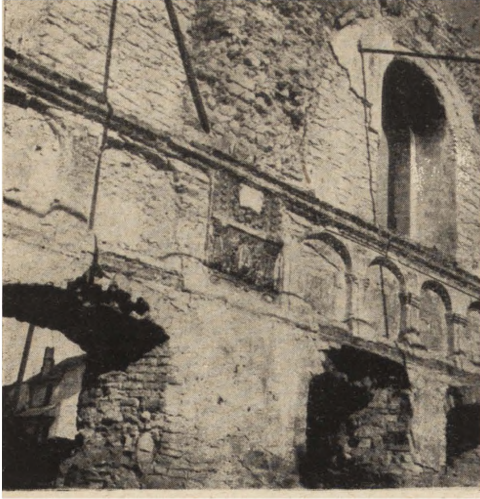
Ryc. 302. Szczepieszyn — bóżnica. Reszta dekoracji wnętrza. Stan z r. 1951.