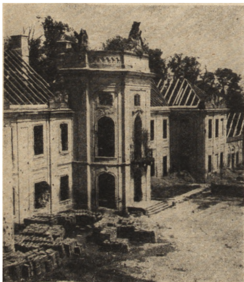
Ryc. 297. Radzyń Podlaski — pałac. Odbudowa wiązania dachowego. Stan z r. 1950.