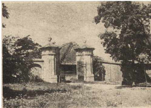
Ryc. 293. Lubartów — pałacowa brama wjazdowa.

Lubartów — pałac Sanguszków, pobudowany jeszcze w XVI w. przez Firlejów, rozbudowany w w. XVII