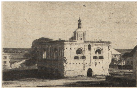
Ryc. 306. Szczepleszyn — bóżnica. Stan z r. 1950.

Z ciekawszych prac konserwatorskich przy restauracji zabytków malarstwa stałogowego można wymienić: Bitwę pod Trębowlą , obraz malowany na płótnie. Odnaleziony na strychu pałacu Zamoyskich w Klemensowie złożony kilkakrotnie, zalany naftą, był mało czytelny: spod luszczącej się farby wyglądało w wielu miejscach płótno. Po zdublowaniu, uzupełnieniu i odczyszczeniu, ukazał się świetnie skomponowany obraz o batalistycznej treści (domniemany Altomonte). Madonna z Dzieciątkiem — obraz malowany na desce z kościoła OO. Dominikanów w Lublinie. W czasie konserwacji dokonanej ostatnio zdjęto barokowe bezceremonialne przemalowania, odsłaniając okazałe nieco gotyckie malowidło, pochodzące zapewne z początku XVI w. Madonna trzyma w jednej ręce gruszkę , na