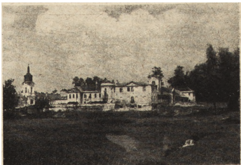
Ryc. 295. Radzyń Podlaski — pałac. Widok ogólny od południa.