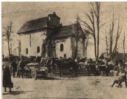
Ryc. 299. Szczebrzeszyn — cerkiew. Stan z r. 1951.

Szczebrzeszyn — bóżnica renesansowa, pochodząca z końca XVI wieku, odznaczająca się charakterystycznym lamowanym dachem i interesującą dekoracją