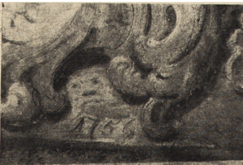
Ryc. 305. Lublin — polichromia w katedrze. Fragment z datą i przypuszczalnym autoportretem malarza. Stan z r. 1952.

stukową wnętrza (ryc. 302 i 306), uległa całkowitemu wypaleniu w 1939 r.; runęło wówczas sklepienie, a kamienne mury zewnętrzne lasowały się pod wpływem zmian atmosferycznych. Obecnie przystąpiono do zabezpieczania pozostałych murów zewnętrznych i przygotowania więźby dachowej. Bóżnica po odbudowie ma być przeznaczona na cele kulturalne — świetlicę i bibliotekę.