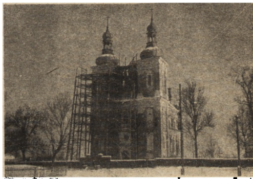
Ryc. 300. Gołęb, pow. puławski — odbudowa kościoła par. Stan z r. 1951.