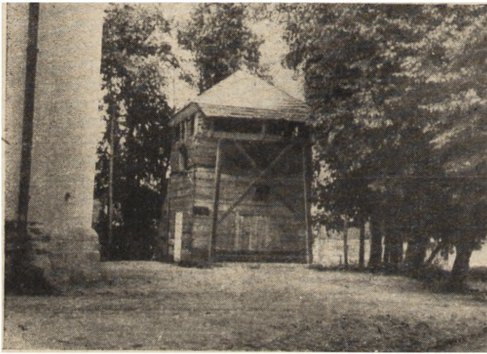
Ryc. 304. Bychawa, pow. lubelski — dzwonnica przy kościele par. przed rozpoczęciem robót. Stan z r. 1951.