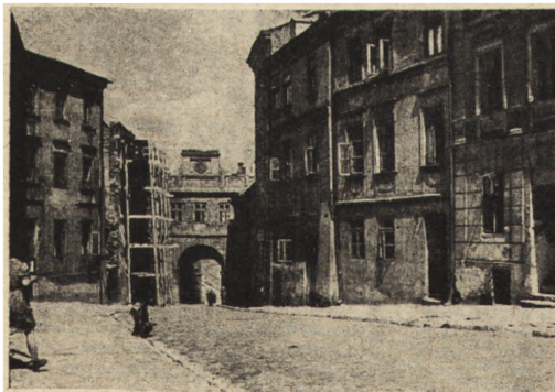
Ryc. 292. Lublin — kamienica przy ul. Grodzkiej 34 po rozpoczęciu robót. Stan z roku 1952.

cy Podzamcza, uległ w czasie okupacji prawie całkowitej rozbiórce. Odbudowa tego budynku, leżącego u samego podnóża Bramy Grodzkiej, wiązała się jednocześnie z zabezpieczeniem trwałości murów tej ostatniej. Prace budowlane prowadzone obecnie — przesklepienie stropami ogniotrwałymi i nakrycie dachem — zakończone będą z wiosną 1953 r. a budynek oddany zostanie do użytkowania Liceum Sztuk Plastycznych na cele szkolne. Również przy ul. Grodzkiej 32 i 34 podjęte zostały prace mające na celu zapełnienie luki w zabudowie ulicy (ryc. 292). Luka ta powstała już w okresie międzywojennym, kiedy to runął budynek pod nr. 32; postępująca dewastacja ogarnęła i budynek sąsiedni, z którego dziś stoi tylko frontowa ściana. Ściana ta, jedna z nielicznych, zachowała część dolną muru atykowego z zachowanymi podziałami. Obecnie po częściowym odgruzowaniu przystępuje się do robót zabezpieczających. Po odbudowie budynki służyć będą celom kulturalno-społecznym.