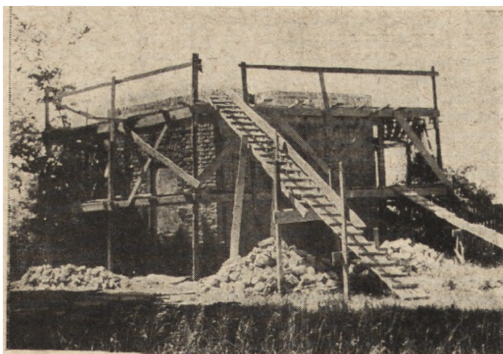
Ryc. 290. Puławy — odbudowa domku chińskiego. Stan z r. 1951.