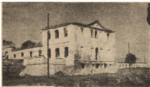
Ryc. 296. Radzyń Podlaski — pałac. Pół-wsch pawilon narożny. Stan z r. 1950.