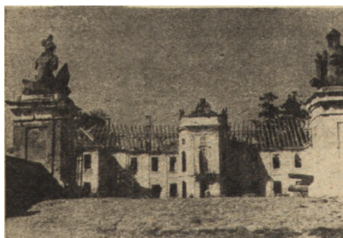
Ryc. 298. Radzyń Podlaski — pałac. Widok od wjazdu. Stan z r. 1950.

i XVIII, stał pustką i był niemal ruiną po zniszczeniach wojennych pierwszej wojny światowej. Nabyty w latach dwudziestych przez zgromadzenie zakonne, które przystąpiło do jego odbudowy, uległ spaleniowi w roku 1934 w zagadkowych okolicznościach. Od tego czasu pozostawał w ruinie i opuszczeniu. Pierwsze roboty zabezpieczające rozpoczynają się już w roku 1947. Uratowano część wystroju rzeźbiarskiego prawie całkowicie zniszczonego pożarem. W etap zasadniczych robót wkroczone w roku 1950. Zmontowano wówczas nad budynkiem stalową więźbę dachową i przystąpiono do odbudowy murów konstrukcyjnych południowej części budynku. W następnych latach prowadzono te roboty w dalszym ciągu zabezpieczając mury części północnej i wykonując stropy Akermana. Znaczna kubatura budynku i ograniczone środki finansowe nie pozwalają na szybsze tempo robót (ryc. 293 i 294). Pałac przeznaczony jest na siedzibę miejscowych rad narodowych.