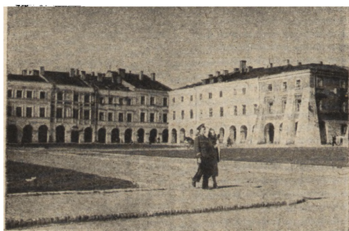
Ryc. 291. Zamość — kamienice Ryнку Głównego. Porządkowanie fasad kamienic w sierpniu 1951.