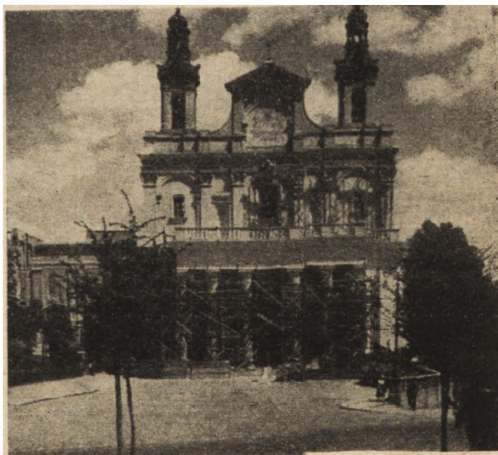
Ryc. 301. Lublin — katedra. Roboty wykończeniowe przy portyku kolumnowym. Stan z r. 1951.