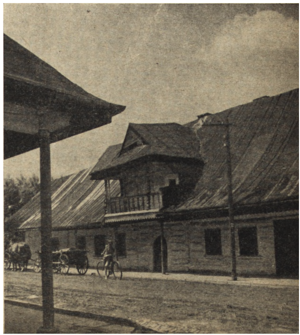
Ryc. 61. Andrychów — dom drewniany podcieniowy XVIII w. Stan z r. 1952.

W dzielnicy Kazimierz kontynuowano odbudowę charakterystycznej kamieniczki z XVII wieku przy ul. Józefa 40, w której uprzednio w czasie robót odkryto liczne renesansowe detale architektoniczne. W budynku położono stropy żelbetonowe, doprowadzając obiekt do stanu surowego. Odbudowana została także zabytkowa kamieniczka przy ul. Szerokiej 28, gdzie wzniesiono nowy dach, wykonano prace wnętrzowe i fasadowe. Remont powyższy prowadzony był przez Fundusz Gospodarki Mieszkaniowej przy współudziale Konser-