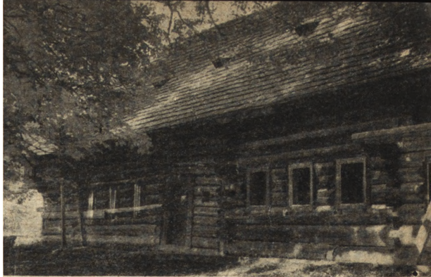
Ryc. 60. Zubrzyca Górna — Dwór Moniaków z 1784 r. Stan z r. 1953 przed konserwacją.

K r a k 6 w. Na pierwsze miejsce wysuwają się prace o charakterze rekonstrukcyjnym, inwestowane przez Uniwersytet Jagielloński przy budynkach Collegium Maius i Collegium Iuridicum. W pierwszym obiekcie kontynuowano tu roboty mające na celu usunięcie neogotyckiej przebudowy z XIX wieku i przywrócenie temu czołowemu zabytkowi pierwotnego charakteru.