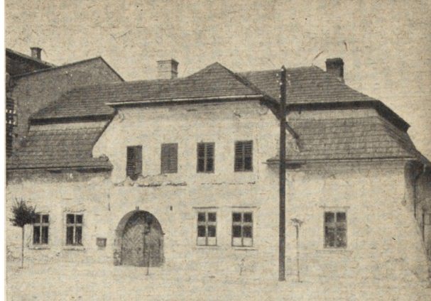
Ryc. 64. Stary Sącz — dom mieszczkański tzw. „na Dołkach”. Stan przed konserwacją 1953 r.

Jeleśnia , pow. Żywiec. W znajdującym się w złym stanie zachowania zabytkowym starym zajęzdzie drewnianym z XVIII wieku, wzmocniono ściany oraz