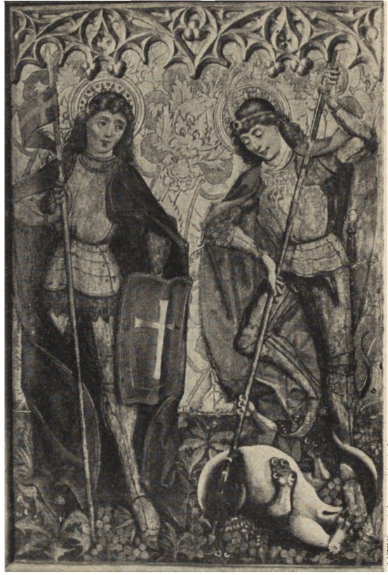
Ryc. 69. Więclawice. — kwaterna tryptyku z 1477. Stan w czasie konserwacji w r. 1952.

pierwotnej koncepcji ikonograficznej, która wyobrażała postać św. Mikołaja w otoczeniu diakonów Szczepana i Wawrzyńca.