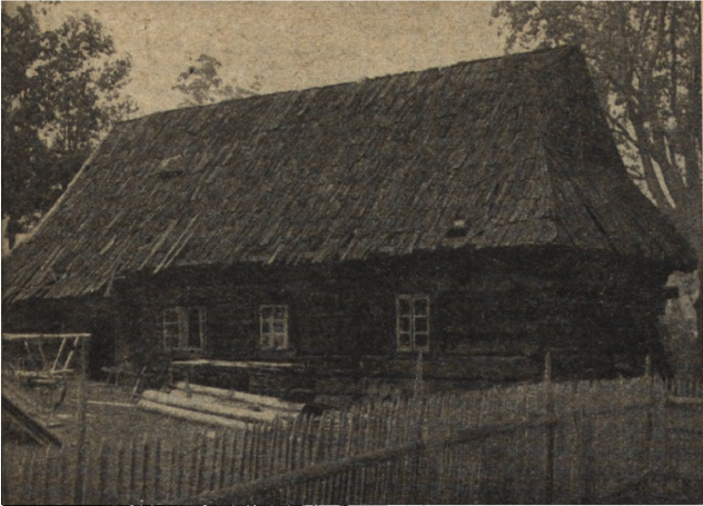
Ryc. 58. Zakopane — chata „Sabały“. Stan z 1953 r. przed wymianą pokrycia dachu.

Matejki, przedstawiające zamek i jego detale architektoniczne z czasu przed ostatnimi przebudowaniami.