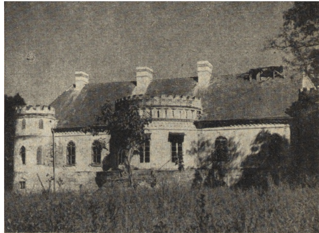
Ryc. 56. Janowice — dwór w r. 1952.