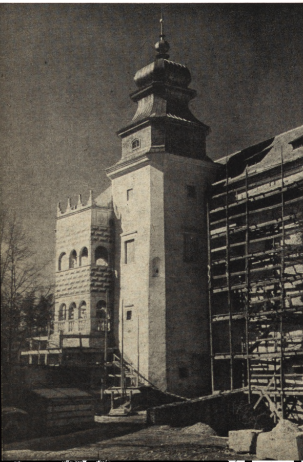
Ryc. 54. Pieskowa Skala — zamek. Zrekonstruowana loggia. Stan z 1953 r.

w Zubrzyca Górnej, Zakopanem czy Białce Tatrzańskiej. Konserwacja polichromii oraz zabytków ruchomych podejmowana była przeważnie przez Pracownię Konserwacji Zabytków — Zakład w Krakowie.