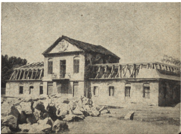
Ryc. 65. Kraków — stary zajazd, ul. Białoprowadnicza 3. Stan z r. 1952 w czasie robót konserwatorskich.