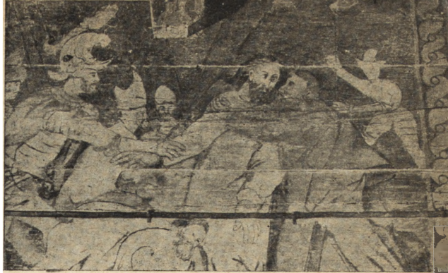
Ryc. 66. Raclawice Olkuskie — fragment odsłoniętej polichromii w kościele parafialnym.

Poza wymienionymi pracami prowadzono jeszcze szereg konserwacji na terenie Krakowa, jak restauracja fresków ruskich w kaplicy Świętokrzyskiej w katedrze na Wawelu, czy roboty w krużgankach kościoła św. Katarzyny, lub kontynuacja zabiegów nad zabezpie-