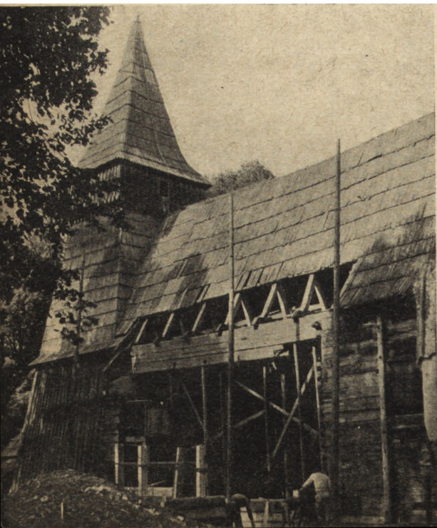
Ryc. 59. Białka Tatrzańska, kościół drewniany z ok. 1700 r. Roboty konserwatorskie w 1953 r.

K s i ą ż W i e l k i , pow. Miechów. W tu-tejszym pałacu renesansowym, przebudowanym w wieku XIX, roboty remontowe miały na celu dalsze zabezpieczenie obiektu przez remont dachu, odwodnienie budynku, a także dostosowanie do użytkowania na cele szkolne. W związku z odkryciem w czasie prac śladów renesansowej klatki schodowej, projekt i wykonanie tej ostatniej odłożono do czasu ukończenia dokumentacji naukowej i technicznej.