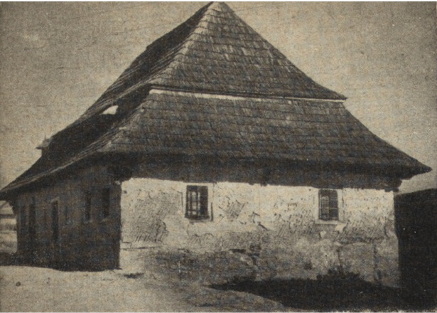
Ryc. 62. Podwilk — stary zajazd drewniany przed przewiezieniem do Zubrzyicy Górnej we wrześniu 1953.

watora na cele mieszkalne. Rozpoczęto również odgruzowanie zrujnowanej kamienicy mieszczańskiej przy ul. Szerokiej 38, przygotowując obiekt do przyszłej odbudowy.