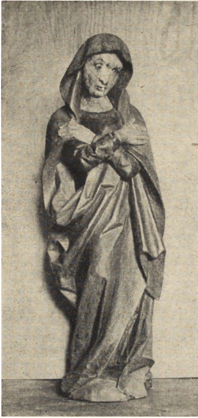
Ryc. 68. Raławice Olkuskie — rzeźba M. B. Bolesnej z grupy w tęczu kościoła drewnianego. Stan z r. 1953.