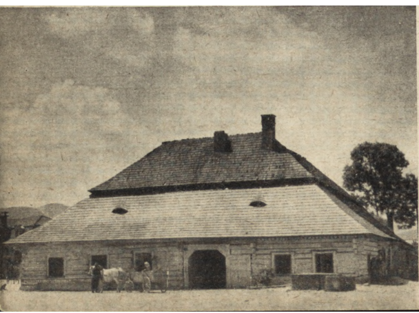
Ryc. 63. Jeleśnia — stary zajazd. Stan z 1953 r.

architektoniczne zamknięcie tej ulicy, która wzięła swą nazwę od historycznego traktu prowadzącego do Pilzna. Wybudowanie więźby dachowej wraz z pokryciem oraz klatki schodowej, umożliwiło przejęcie obiektu w użytkowanie na cele szkolnictwa artystycznego z przeznaczeniem na internat młodzieżowy.