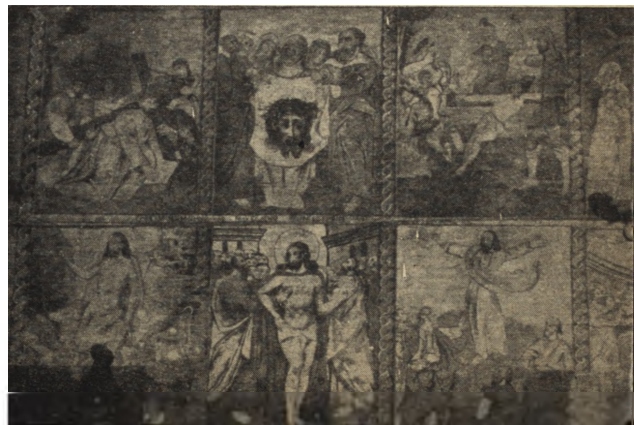
Ryc. 67. Raclawice Olkuskie — polichromia płn. ściany nawy kościoła po konserwacji w 1953 r.

Więclawice, pow. Miechów. Przekazano do fachowej konserwacji pochodzący z roku 1477 tryptyk z miejscowego kościoła parafialnego. Środkowa scena przedstawiająca w wyniku późniejszych zmian kompozycję Trójcy Św. została doprowadzona do