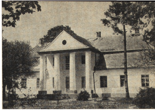
Ryc. 55. Ochodza — dwór w czasie konserwacji w 1953 r.

Dębno, pow. Brzesko. Przywrócono w znacznej mierze pierwotną sylwetkę tutejszego zamku pochodzącego z wieku XV, jednego z najlepiej zachowanych obiektów tego typu. Uzyskano to głównie przez przebudowę części dachów, a także przez rekonstrukcję drewnianych ganków dziedzińca, wspartych na kamiennych krokostynach. We wnętrzu budynku położono kilka stropów i kontynuowano prace kamieniarskie. Dużą pomocą przy rekonstrukcji tego obiektu były zachowane w znacznej ilości rysunki Jana