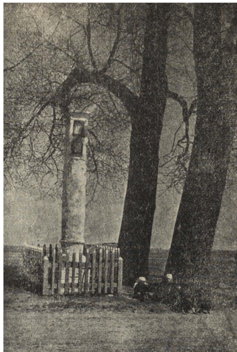
Ryc. 133. Bieliny, pow. rawski — figura barokowa.

wili go zburzyć. Dopiero na interwencję ówczesnego konserwatora woj. warszawskiego zaniechali tego.