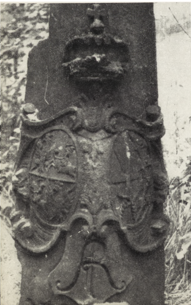
Ryc. 132. Zgorzelec. Słup pocztowy — widok narożnego kartusza herbowego.

Bielany — Łowicz — Błonie do Warszawy, a od 1732 r. także trzeci przez Poznań obsługiwała poczta zorganizowana w 1706 r. z polecenia króla Augusta II przez Adama Fryderyka Zürner'a znanego kartografa i komisarza dróg saskich i polskich 2 .