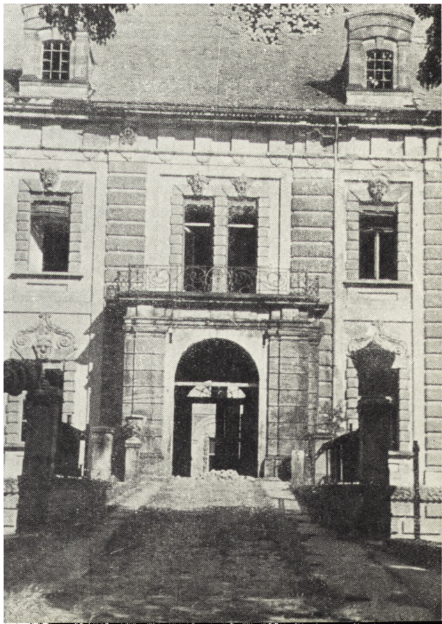
Ryc. 134. Pałac w Żaganiu. Portal elewacji zachodniej.